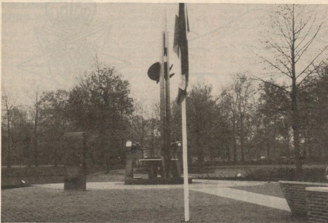
Waar het standbeeld thuishoort van "ONZE GENERAAL"

Ik stel mijn volledige vertrouwen in U allen, welke rang en welke functie Gij ook moogt bekleeden.