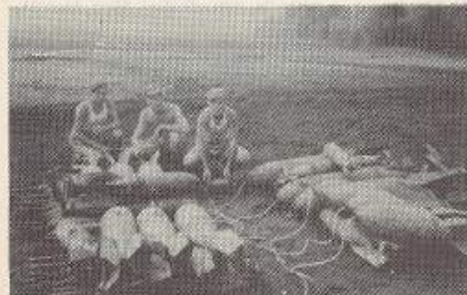
Bommen ruimen in Kediri, Kerstmis 1948