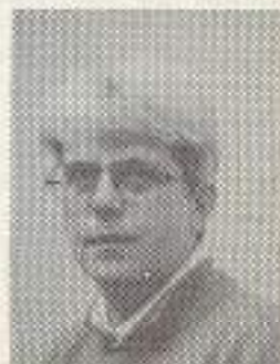
Consulent M.N.F. IJsselsteyn