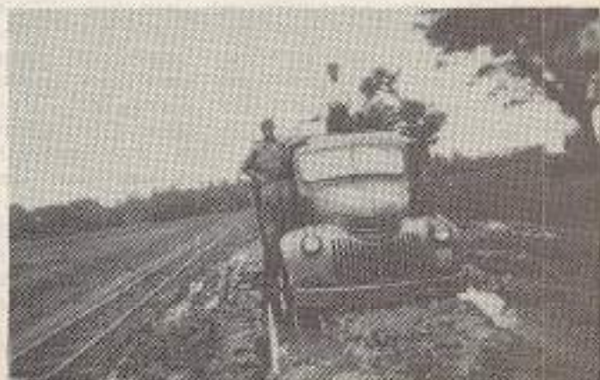
De slechte weg van Tjilamaja, Kerstmis 1947