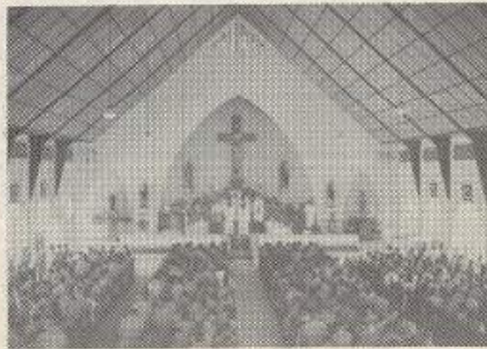
De kerkelijke viering van het Kerstfeest in Padang 1947