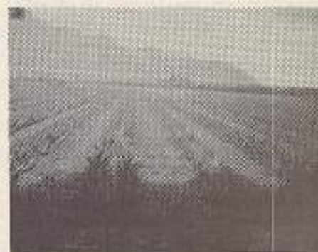
Sisalplantage bij Djember, jammer ik heb geen foto van het kerkje daar. Kerstmis 1949.