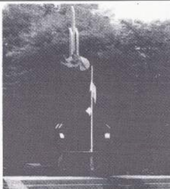
Foto: Nationaal Indië-monument te Roermond

Elk jaar vindt op 7 september om 14.00 uur bij dit monument een Nationale Dodenherdenking plaats.