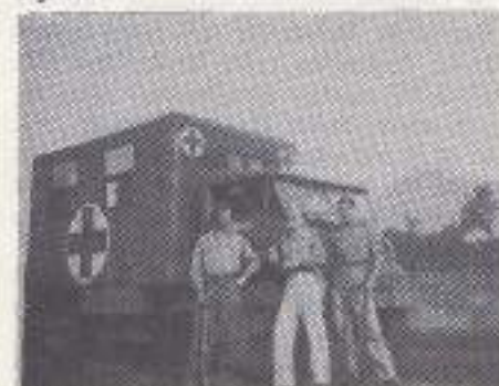
Even poseren tussen Bandung en Garut januari 1949.

In Tjandjoer gekomen, waar wij op 21 maart 1947 werden gedetacheerd bij 8 R.V.A., konden wij gelukkig de stijf geworden ledematen strekken en daar zaten wij dan in de ons toegewezen "villa". We hadden geluk want juist enkele dagen daarvoor hadden de technici van de "W-Brigade" dit huis verlaten en hadden de tafels laten staan. Om te kunnen werken moest er veel worden gedaan om onze kamer op een laboratorium te doen lijken.