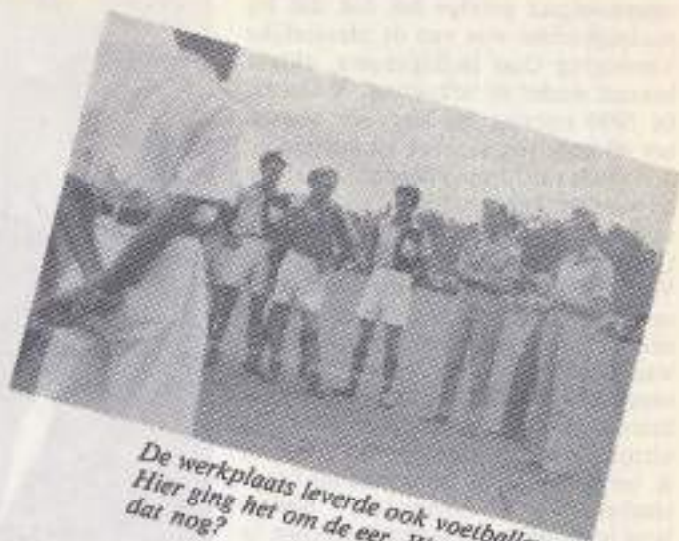
De werkplaats leverde ook voetballers. Hier ging het om de eer. Waar vindt je dat nog?