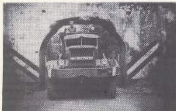
Sobat Bokhorst verzamelde met zijn break down klanten die gestrand waren