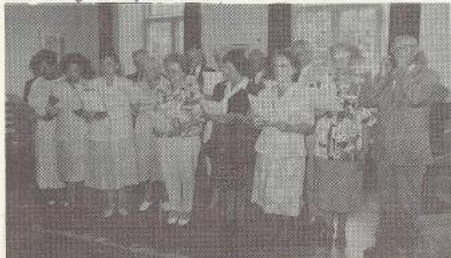
Het gemengde koor van de "Schutters" uit Wijchen brachten de première van het VOMI-lied