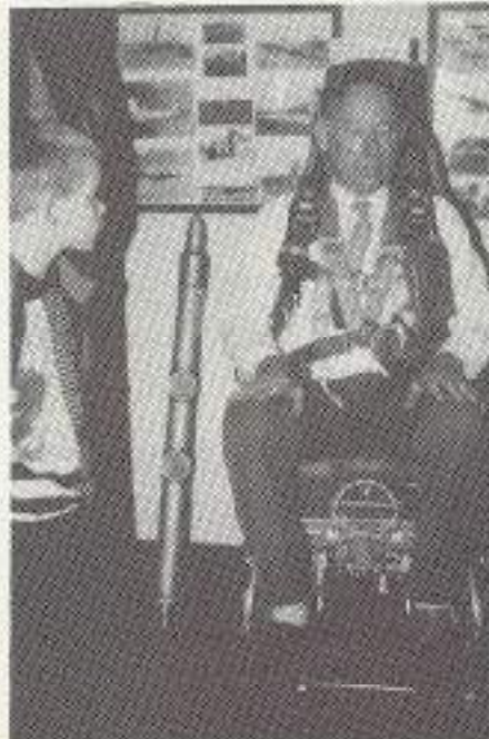
Opa is er klaar voor springen maar.

Bij binnenkomst zie je direct al de resten van de V-1 en V-2 en aan de andere kant Ster (1937) en Lijnmotoren (1934). Verder de resten van een Duitse Focke Wolff 190, een motor van een