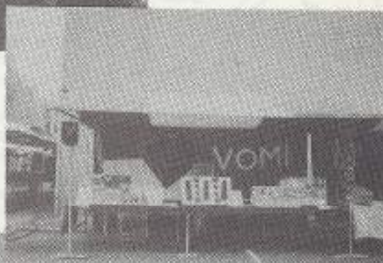
„Onze kraam“ is ingericht