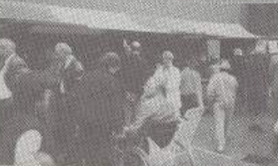
We trokken veel kijkers