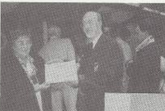
„Onze prijs“ is binnen

De activiteiten-commissie, V.O.M.I. Noord-Brabant West