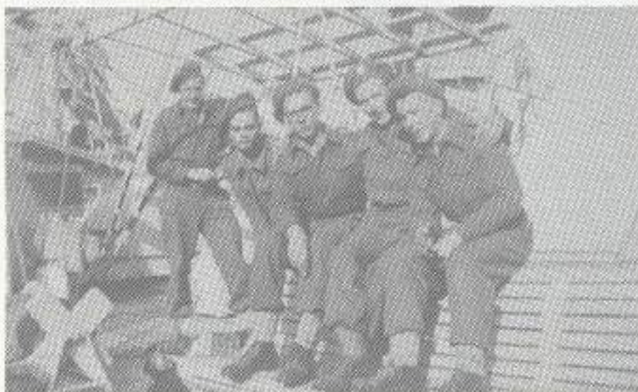
Netjes in Europa.

Nu, op een enkele uitzondering na, de dienstplichtigen ook in "werkpak".