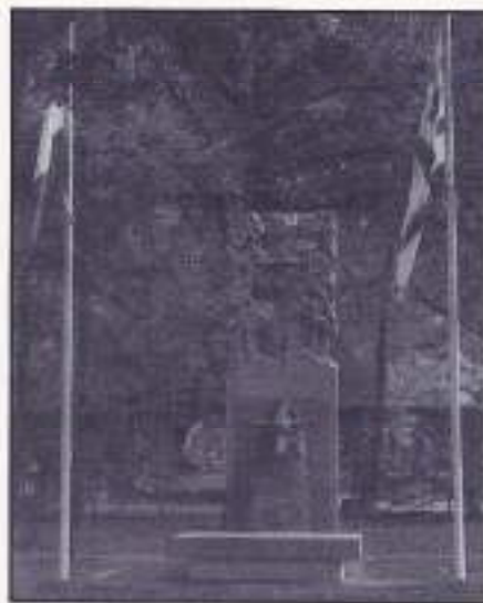
bij het sneuvelen van een militair. Door het in negatief weghakken van

deze vormen krijgt het geweer meer het karakter van een ravijn en dit geeft met de gehakte plantenvormen een illusie van Indië.