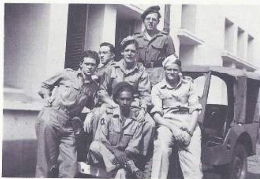
"Voor de kaserna 'Aanvullingsplaats' te Buitenzorg"