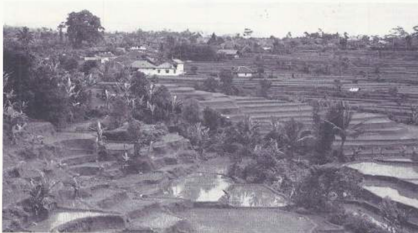
Rijstvelden langs de weg Garut-Tasikmalaja