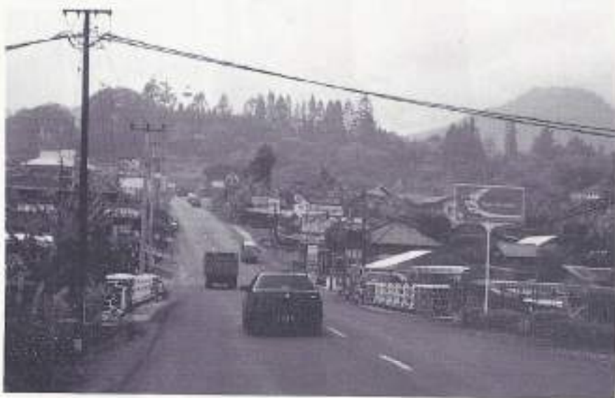
Grote Postweg Bogor-Puncak

Computerschool, waar ze kennelijk erg trots op waren. Te voet ging ik verder o.a. langs de rommelige Jalan Tongol met veel sloopstoeleveringsbedrijfsjes via Pasar Ikan, waar de raten onder de stalletjes rondliepen, naar het maritiem museum "Baktari" bij de haven. Ik liet me door de museumgids, die weinig had te doen, overhalen om met een klein bootje de oude haven te bezichtigen. Het weer was prima met aan de hemel een lichte sluierbewolking. Heel schilderachtig, de vaak in op-