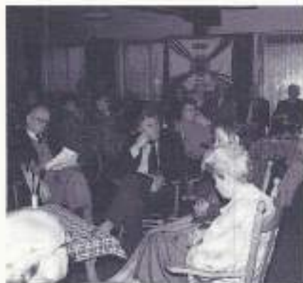
Samenzijn in Stroe