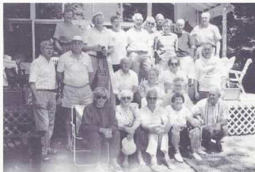
M.T. 4-9 R.I. met de "Canadezen"

Na 4 dagen werd er telkens gewis-seld, zodat ieder groepje dan bij ie-