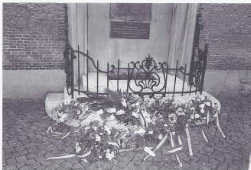
Onthulling gedenkplaat gesneuvelden Goes.

In de recent achter ons liggende jaren is door de V.O.M.I. de draad weer opgenomen.