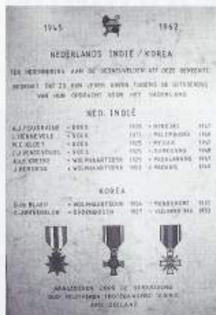
Overhandigde oorkonde aan gemeente Goes.

V.O.M.I. Zeeland is echter van mening dat de namen van de gesneuvelden niet mogen worden vergeten en deze onder de aandacht van het publiek moeten worden gebracht.