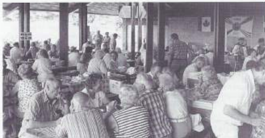
Aan de lunch met o.a. lekkerbekjes, kroketten en haring uit de kantine van Maggie's Meat Market.