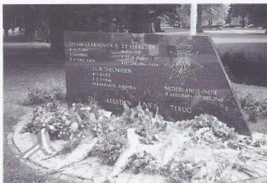
15 augustus 1996 Indië-monument Vught, bloemenpracht.

In november hopen wij een bijeenkomst te houden in de regio Eindhoven; ook hier worden weer de leden en belangstellenden persoonlijk uitgenodigd; let u verder op de aankondigingen in de dag- en weekbladen.