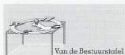
Van de Bestuurstafel

Bron: 'Trivizier 13 Juridische zaken' column 3/97 Dick Berts, reserve-officier bij het Korps Mariniers en journalist.