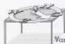
Van de Bestuurstafel