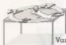
Van de Bestuurstafel

De herdenking te Roermond is achter de rug. Gelukkig een keer geen regen. Mooi strak georganiseerd door de Stichting.