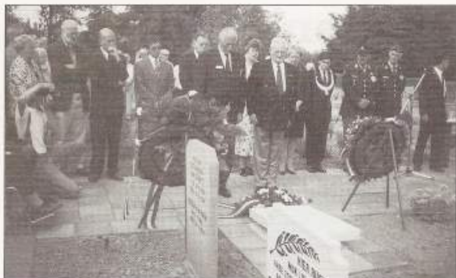
Kranslegging bij de gedenksteen op de begraafplaats van Numansdorp.

Verbindingspeloton van 3-3 R.I., alsmede door verschillende nabestaanden.