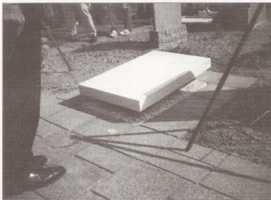
Onthulling gedenksteen op de begraafplaats van Numansdorp.

Vrijdag 15 augustus 1997 is op de begraafplaats van Numansdorp de gedenksteen onthuld ter nagedachtenis van 6 gevallen uit Cromstrijen (gemeenten Numansdorp en Klaaswaal), die tussen 1941 en 1950 in het voormalig Ned.-Indië en elders zijn omgekomen.