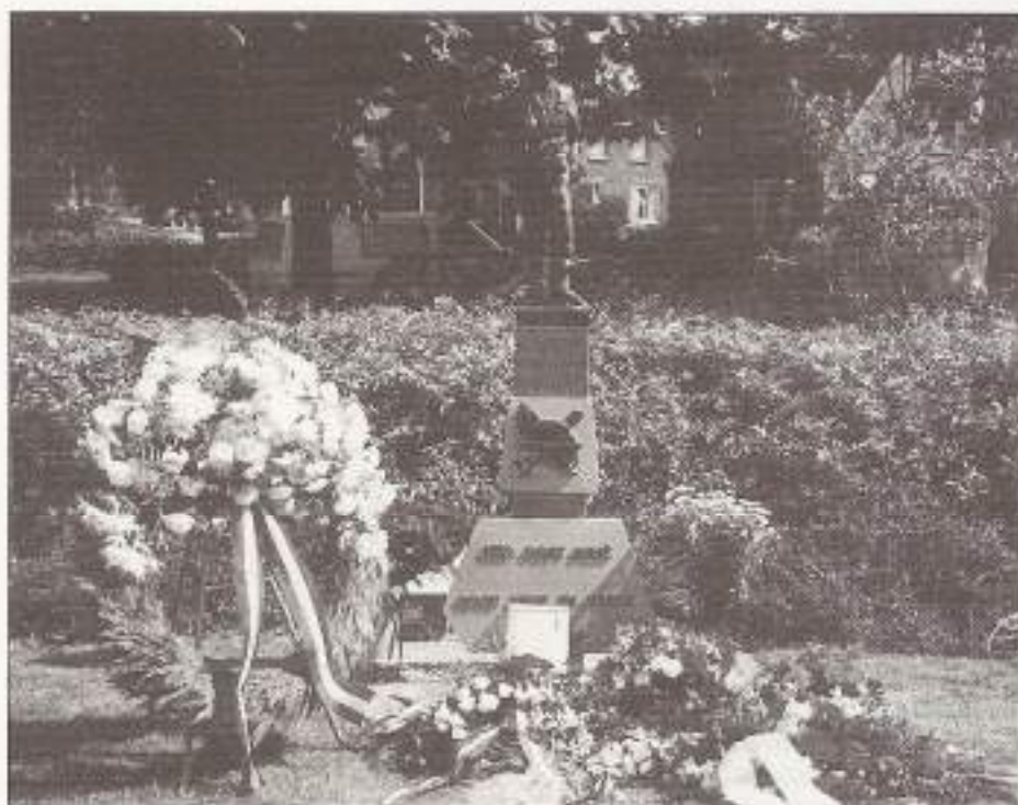
Monument te Dalen

Neemt u een prijsje mee voor de verloting?