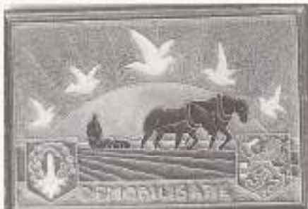
Demobilisatie (10,5x15 cm)