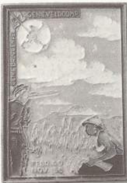
Genie Bruggenpel. 42 Genieveldcomp. Febr. '49-Nov. '50 (20x14,5 cm.)