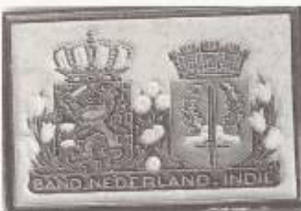
Band Nederland-Indië (10,5x15 cm.)