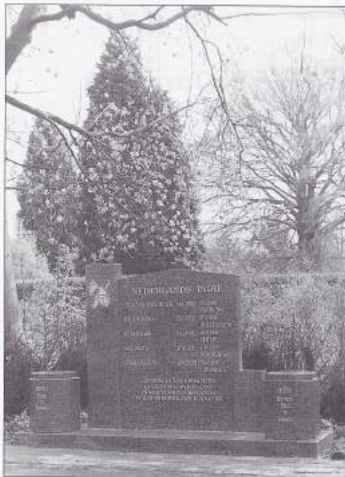
Onthuld op 18 april 1998

Culemborg heeft zijn monument gekregen voor de in voormalig Nederlands-Indië overleden Culemborgse militairen uit de periode 1945-1950.