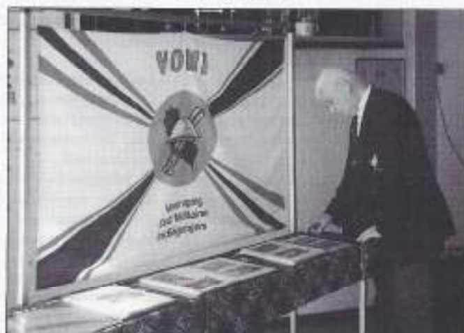
VOMI-stand reünie 4-7 RI.