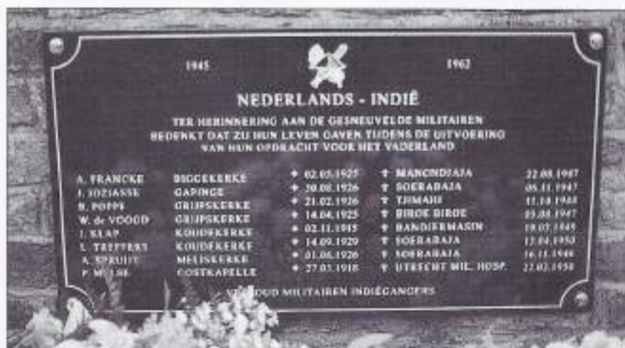
Onthulling gedenkteken gesneuvelden Ned. Indië in de gemeente Veere.