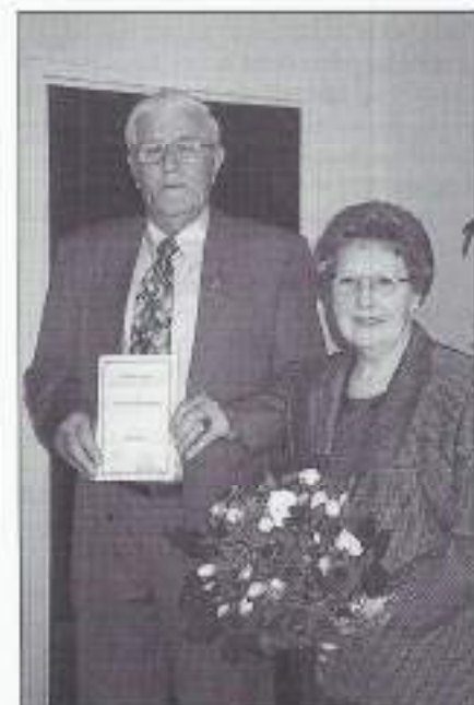
Uitreiking Gewonden Insigne op 23 april 1999 te Zwijndrecht