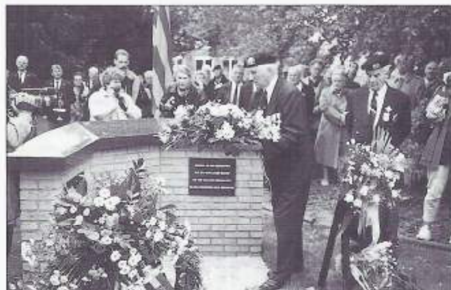
Onthulling Indië-monument Middelharnis.