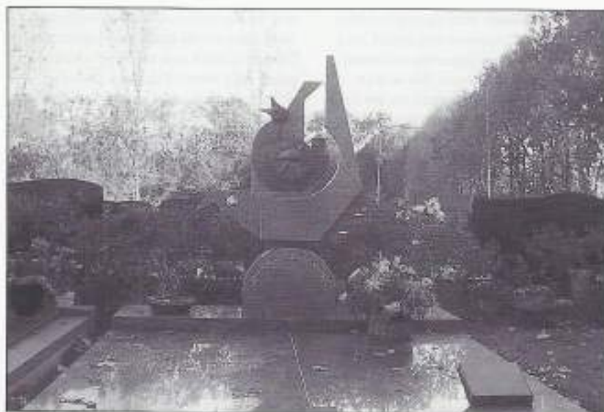
Rechtsonder op de foto is er nog een plaquette waarop de hiernavolgende (verklarende) tekst geschreven staat: