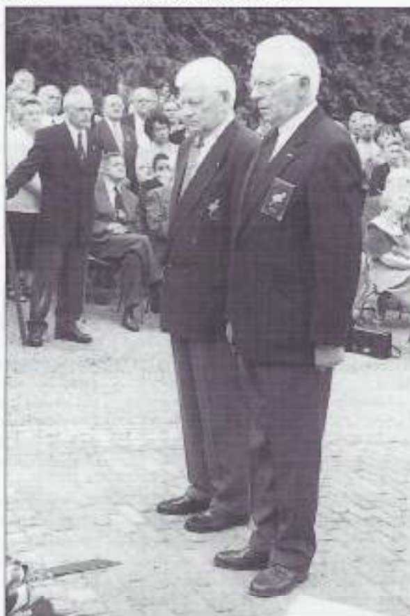
Links voorzitter en Rechts secr. VOMI Noord-Brabant Oost

Deze herdenking was stemmig en sfeervol. Wij hopen op een lange traditie. Geldrop bedankt!