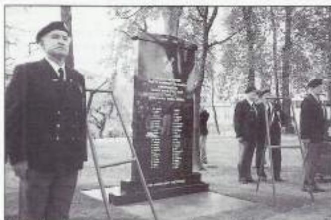
Gedenkzuil met namen van omgekomen Arnhemmers.

guerilla-oorlog. Aan de houding van de overheid werd aandacht geeschonken: geen aandacht, geen hulp, geen begrip. Ook werd ten overstaan van allen een lakse houding van gemeentebesturen gehekeld. (Wie de schoen past...) De burgemeester van Arnhem trachtte het verschil of de samenhang tussen een oorlogsmonument en vredesmonument duidelijk te maken. Ook stond hij stil bij de bruggen in Arnhem, die allen naar beroemde persoonlijkheden zijn vernoemd, daarmee aangevend dat Arnhem zeer zeker zich betrokken voelt met vrijheidsstrijders, zoals John Frost, Andrej Sacharov en Nelson Mandela. Na deze beide toespraken werd een erewacht gevormd door vier veteranen uit vier verenigingen en werd de gedenkzuil onthuld door Mevrouw