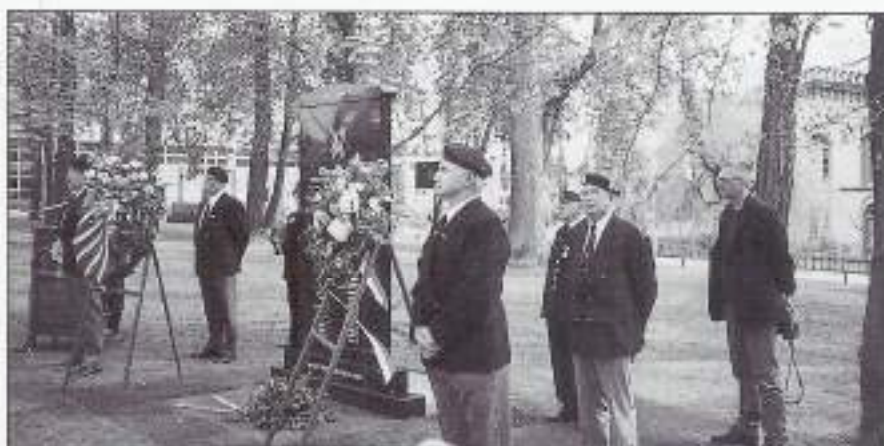
Erewacht bij gedenkzuil na kranslegging.

op 2 mei, dus twee en een half jaar later, kon op het terrein van het KTOMM Bronbeek een gedenkzuil onthuld worden, dank zij giften uit het bedrijfsleven en de burgerij. Ook de gemeente Arnhem kwam op het laatste moment over de brug met een bijdrage van bijna honderd gulden per man, die wij in de tropenjaarde moesten achterlaten. Wij hebben dat bedrag maar niet teruggerekend naar de waarde van toen... Het werd een mooie, stijlvolle plechtigheid, die in eendrachtige samenwerking met collega veteranen-verenigingen (Wapenbroeders, COM, VIM "De Valouwe" en WIVN) tot stand kwam.