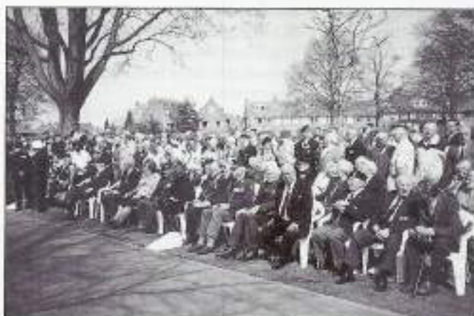
Overzicht van de aanwezigen.

zei: "die nachtmerrie is voorbij". Maar dat bleek voor duizenden jongemannen een illusie. Zij gingen praktisch onvoorbereid in volle troepentransportschepen naar Indië om Orde en Vrede te brengen. Die opdracht mislukte, het moedde uit in een complete