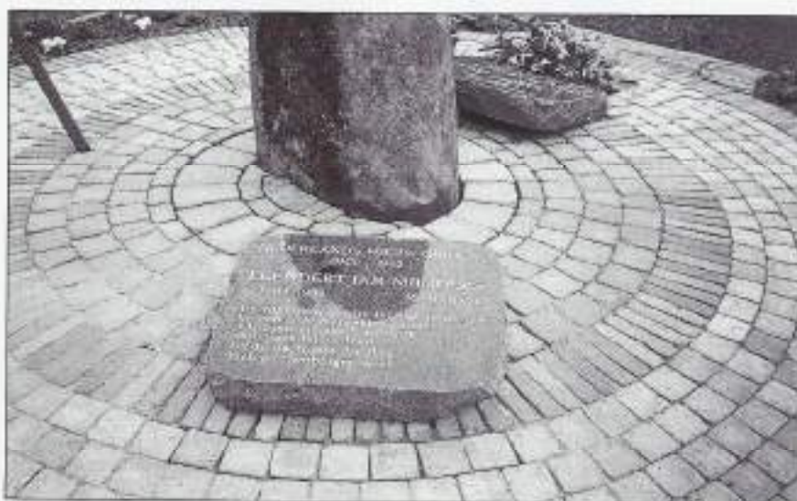
Gedenksteen Dirksland. 30 maart 2001.