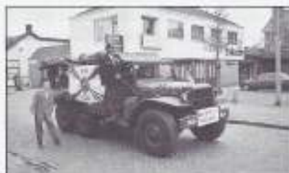
De originele Dodge Beep.

Secr. J. Kloet Laan van Barbestein 8 4451 AH Heinkensand Tel. 0113-561738