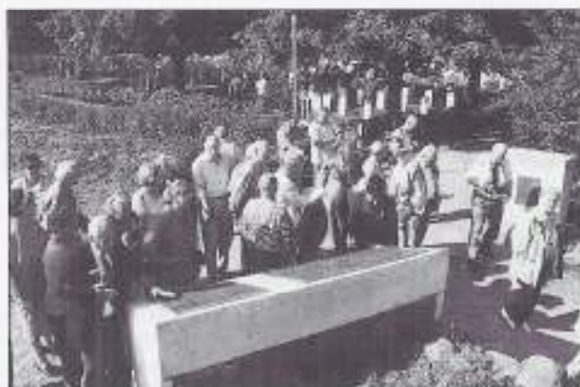
Ook het Duitse Ereveld werd bezocht.

"Immortal Ypres Salient" hebben gestreden. Hulde aan het volk dat de slachtoffers van die verschrikkelijke oorlog nog steeds blijft herdenken.