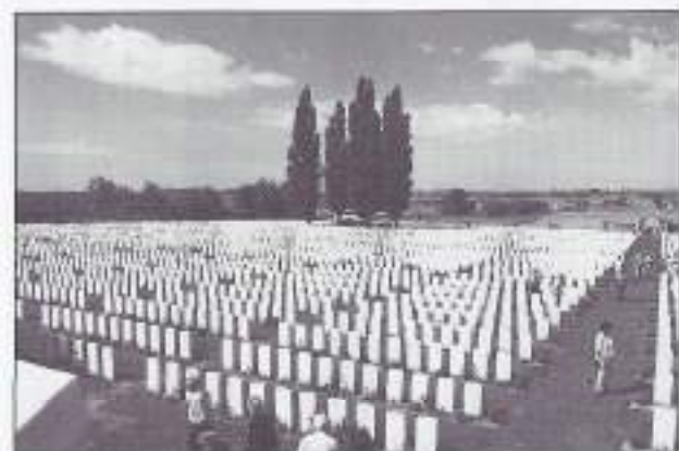
Engels Ereveld, het grootste op het vasteland van Europa.

's Avonds, na het diner, zijn we naar de Menenpoort gegaan om het blazen van de "Last Post" bij te wonen. Erg indrukwekkend, vooral als men beseft dat dit sedert 1928 iedere avond plaats vindt ter ere van de soldaten van het Britse leger die tijdens de oorlog 1914 - 1918 in de