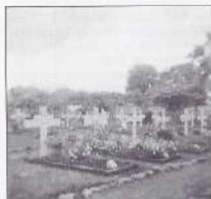
Een Ereveld op Java in oude toestand.