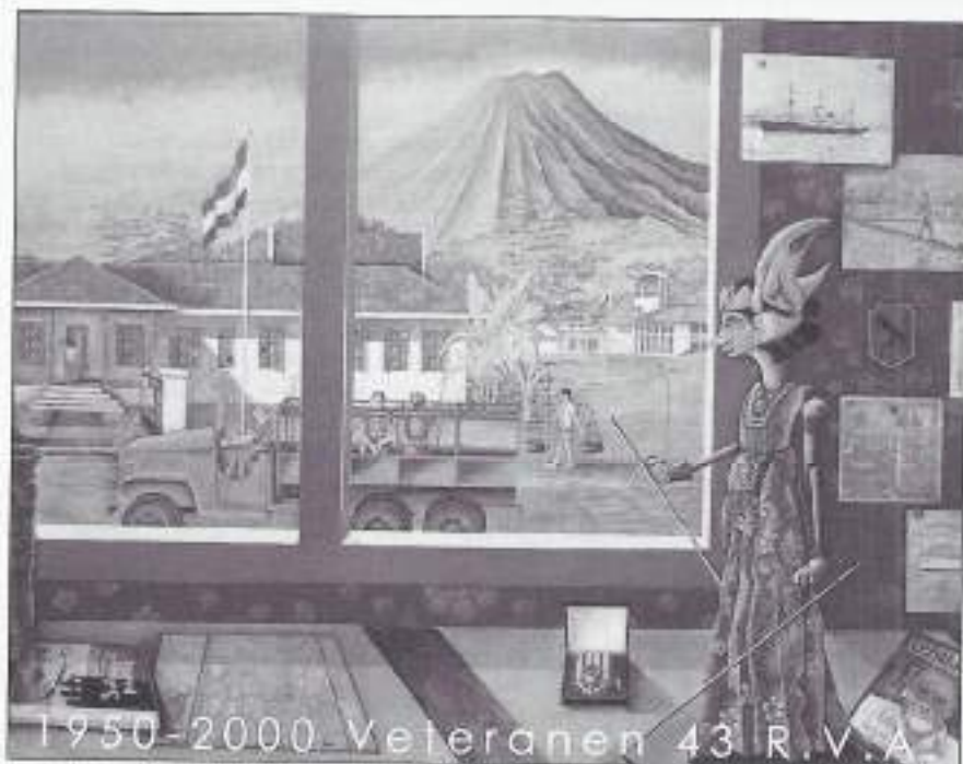
Schilderij van 43 R.V.A. met de diverse betekenissen er in verwerkt. (Zie onderstaande beschrijving).

Op de tafel van links naar rechts enige souvenirs, zoals: een bewerkte huls met inscriptie; het boekje "Scheepspraet" dat we aan boord kregen (met open tips); een leerboekje; eenvoudig spreekmaleis, in 1946 uitgegeven door den Generalen Staf; het Ereteken voor Orde en Vrede; een wajang pop; daarnaast het veteranenblad "De Opmaat" met een artikel over Westerling (tijdens ons verblijf