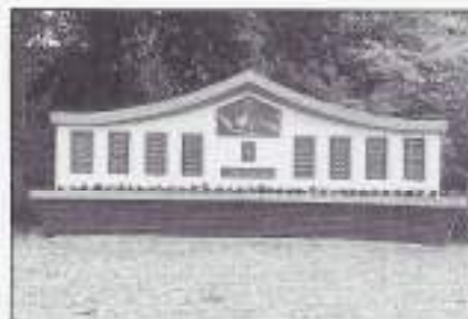
Het monument te Tilburg, onthuld door Mevr. Spoor.

Uden had de première van onze nieu- we aangeschafte video-apparatuur. Het beeld is onvoorstelbaar veel be- ter dan ons oude (gehuurde) appa- raat, dat bovendien niet te tillen was! De techniek staat inderdaad niet stil. De opkomst was weliswaar iets min- der dan we in Uden gewend waren, maar de middag was toch wel ge- slaagd en we konden ook nog nieuwe leden verwelkomen. We blijven door- gaan, zolang we kunnen. Thuisblijvers: U komt de volgende keer toch ook?