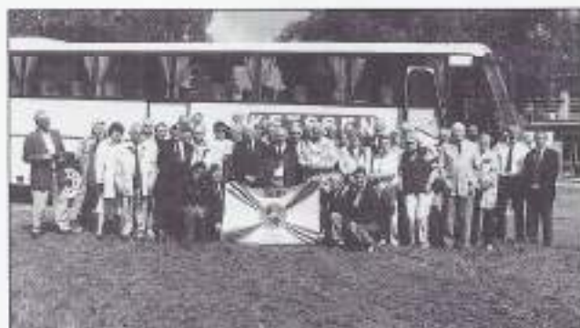
Groepsfoto, genomen op het Marine Complex in Brugge.