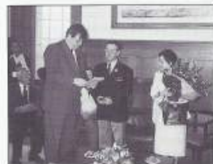
Burgemeester Opstelten bezig met zijn betoog.