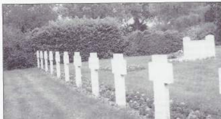
Een ereveld in Nederland.

Het is 4 mei, een klein stadje in het zuidwesten van ons land. Een paar honderd mensen staan bij het monument, dat gewijd is aan hun Poolse bevrijders. Zes soldaten in de houding, drie aan weerszijden van het monument. Het is avond, bijna acht uur. Met de burgemeester en de raadsleden voorop nadert het plaatselijk muziekkorps met omfloerste trommen. Een trompettist wordt met een hoogwerker op een balkon gehesen. Het korps speelt het Poolse en het Nederlandse volkslied. Daarna twee minuten stilte. Dan speelt de trompetter op het balkon de 'Last Post'. Aan de voet van het monument worden kransen gelegd. De vlam wordt ontstoken. Geen enkel woord is gezegd. De menigte gaat uiteen.