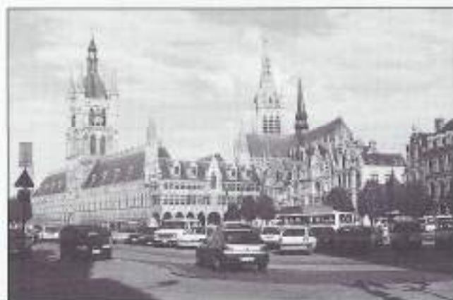
Grote Markt in Ieper met Lakenhallen en op de achtergrond de toren van de Sint-Maartenskathedraal.

VOMI Zuid-Holland Noord had voor 29, 30 en 31 mei jl. een reis georganiseerd naar Ieper, gelegen in het mooie Vlaanderen