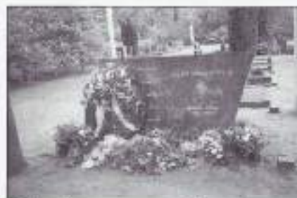
Onthulling monument Gorsseel.

Ter nagedachtenis aan de in 1946 - 1948 omgekomen 6 uit Gorsseel afkomstige militairen, die in het voormalig Nederlands-Indië hun laatste rustplaats vonden, werd op 18 mei jl. een herdenkingsplechtigheid gehouden, waarna een gedenksteen werd onthuld. Het geheel speelde zich af op de even buiten het centrum gelegen begraafplaats.