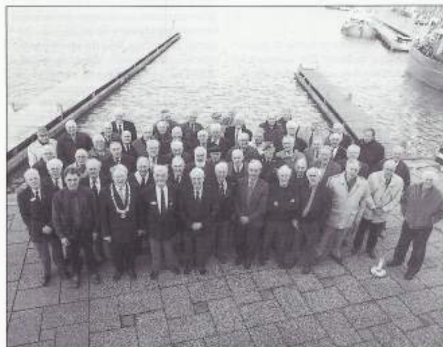
De door de gemeente Boarnsterhim ontvangen oud-Indiëgangers uit deze gemeente met B. en W. uit die gemeente.

De door de gemeente Boarnsterhim ontvangen Oud-Indiëgangers uit deze gemeente met B. en W. uit die gemeente.