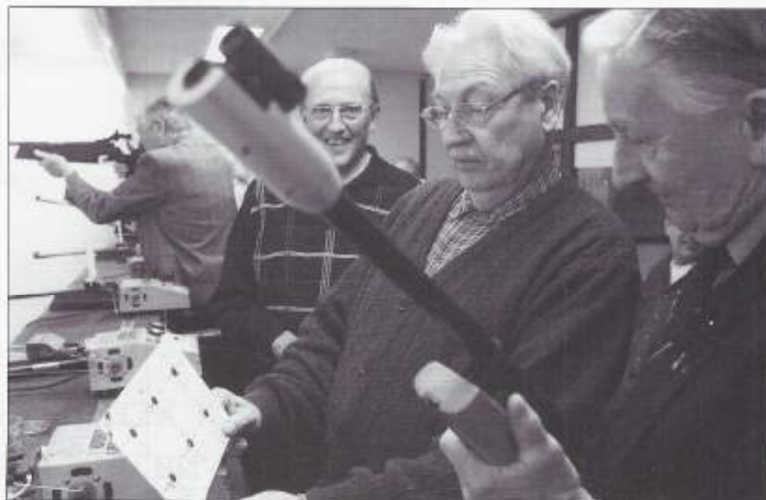
Op 19 februari jl. waren vele VOMI leden uit de regio Zoetermeer e.o. voor de vierde maal te gast bij de plaatselijke schietvereniging. De gastvrijheid en de faciliteiten voor het schieten maakt dat deze middag zeer gewaardeerd wordt door de bezoekende sabats.