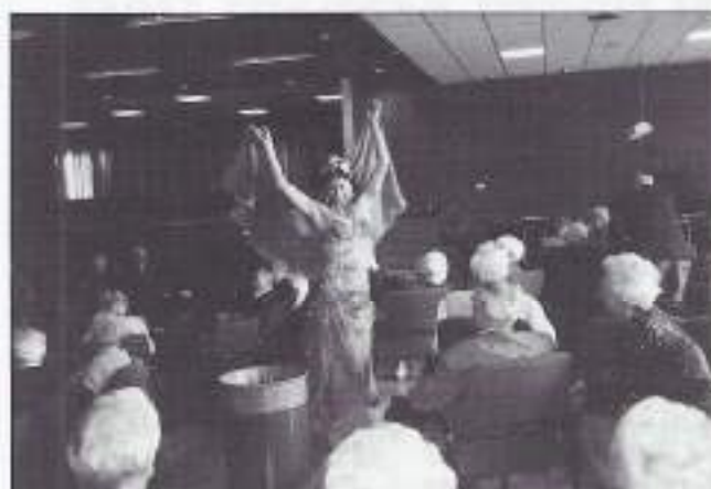
Dansend tussen het publiek in de zaal.

Inmiddels werd op het podium en in de kleedkamers alles in gereedheid gebracht voor het eerste optreden door de 6-vrouws-dansgroep "Oriëntaal Breeze", die gedurende ruim een half uur alle aanwezigen in tropische sferen brachten, gekleed in authentieke kostuums uit de Polinesische eilanden. Een uitermate kleurrijk en muzikaal schouwspel, waar velen niet genoeg van kregen en meerdere sobats moeite hadden met hun leeftijd! Het slotnummer 'Tahiti' was het eind van dit eerste optreden.