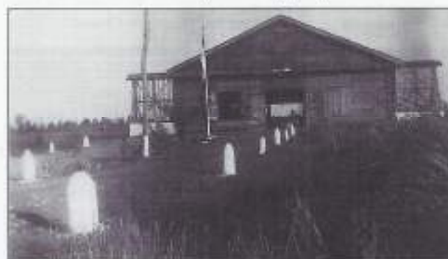
De oude Japanse hangaar.

In december 1950 werd het detachement overgedragen aan de T.R.I.S. (Tentara Republik Indonesia Serikat), waarbinnen het parachute vrouwen nog bijgebracht moest worden.