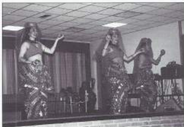
Dansend als op Tahiti in juiste klederdracht.

V.H.K. (Verkoop Hulpen Krasloten) gezamenlijk meer dan 1200 krasloten aan de man/vrouw, waaruit bleek dat de animo voor een gokje ook in deze kringen zeker leeft. En tussen dat alles door werd er ook nog rondgegaan met warme en koude borrelhapjes.