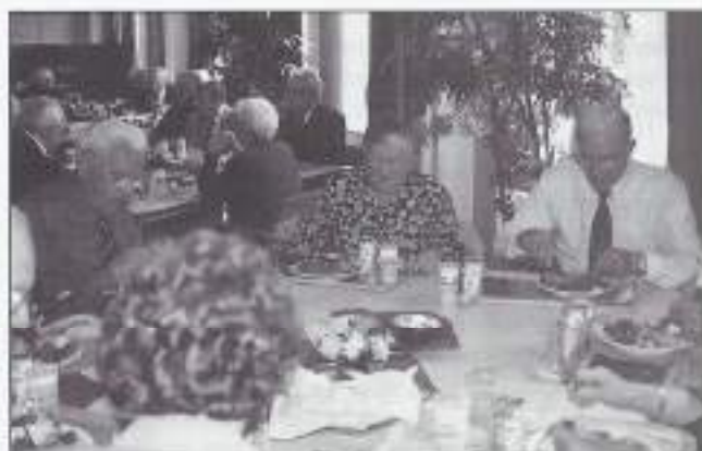
Een voortreffelijke maaltijd.

Al spoedig was het tijd om in gesloten gelederen af te marcheren naar het nabijgelegen 'restaurant'. Voor degenen, die moeilijk ter been zijn, werden pendelbusjes ingezet, waarvan een dankbaar gebruik werd gemaakt. De rijstmaaltijd was in één woord voortreffelijk, je hoorde dan ook overal grote waardering uitspreken.