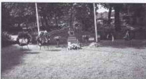
Een overzicht van de gelegde kransen en bloemstukken.