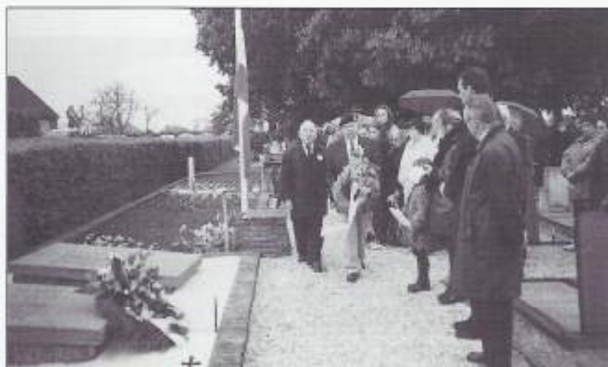
Dodenherdenking 4-5-2002 te Wijk en Aalburg.