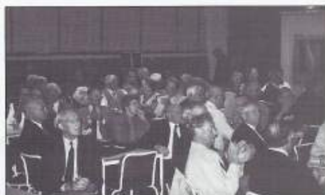
Tot het laatste hoekje in de zaal was alles bezet.

Met na het nagerecht echt genoeg gegeten te hebben werd de terugtocht naar de "Fly Inn" gemaakt. Toen iedereen weer binnen was trad de dansgroep nogmaals voor het voetlicht, gekleed in Oosterse kleding (bijna uit een sprookje uit Duizend en één Nacht) en konden we nu genieten van een perfecte Oriëntaalse show.