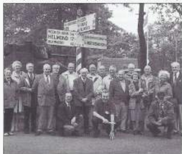
Bezoek aan museum bevrijdende vliegers te Best.

Degenen, die voor de groepsfoto hebben geposeerd, tijdens de excursie naar Best op 24 mei j.l. en die prijs stellen