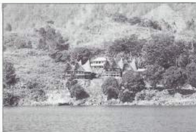
Bloemenland Toba in het Toba-meer.

van de politie in Medan was. Ze mag zich koningin van duizend onderdanen noemen. In Indonesië niets bijzonders. Het wemelt er van de mensen die met verve een vorstelijke titel voeren. Een grote mengeling van koningin en radja's, een ratjetoe, als u het mij toestaat.