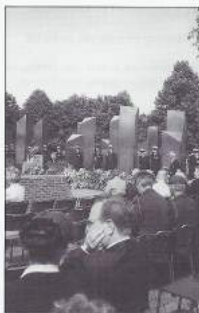
Nationaal Indiëmonument te Roermond.

Die houding, die gezindheid, maakte dat de opgelopen verliezen, in het bijzonder bij de meest betrokkenen des te