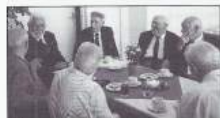
Verjaardagsfeestje met o.a. de aanwezige bestuursleden van VOMI Utrecht en 'I Gooi'.

Dank voor de uitnodiging namens alle aanwezige sobats.