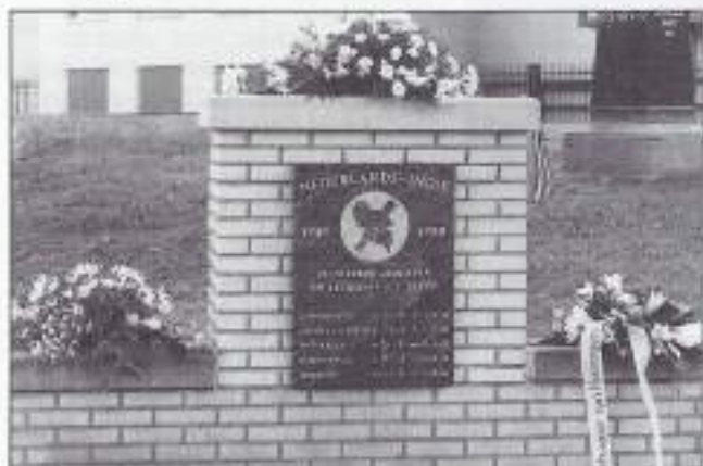
Indië-monument met links het bloemstuk van VOMI Friesland.

De 15e augustus heeft voor de Heerenveeners een extra betekenis gekregen. Niet alleen meer als de dag van de capitulatie van Japan en dus het einde van de Tweede Wereldoorlog, maar ook door de onthulling van hun eigen Indië-monument, waarop de namen staan van de vanuit hun gemeente vertrokken en niet teruggekeerde maten.