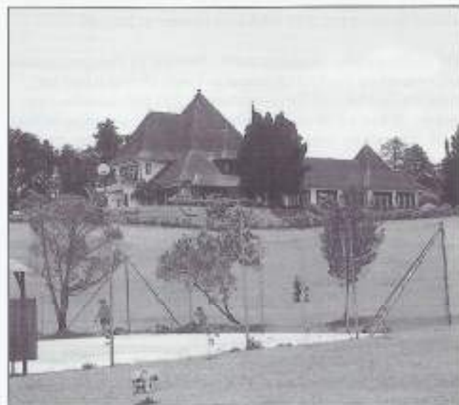
Het voormalig B.P.M. rustoord in Brastagi.

Lunch in Brastagi, het voormalig B.P.M.-rustoord. Op het muurtje voor de deur zit een Indonesische jongen met een waarachtige Friese vlag te zwaaien. Omdat wij taalkundig een andere koers varen, kan ik niet van hem gewaar worden waarom hij het dundoek hier laat wapperen. Binnen is het kolonialerig gezellig. Met boven de haard de niet nieuwe kreet: "Gasten brengen vreugde aan. Is 't niet bij het komen dan is 't wel bij het gaan." En daar zul je als Nederlander op bezoek in Indonesië best eens goed over na kunnen denken.