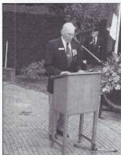
Verwelkoming door de voorzitter.

Op het Raadhuisplein zijn nabestaanden, genodigden en honderden belangstellenden aanwezig en het muziekcorps Christelijke Harmonie Concordia met hun kleurige uniformen completeren het beeld.