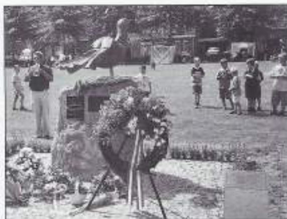
Monument Eersel met trompettist.