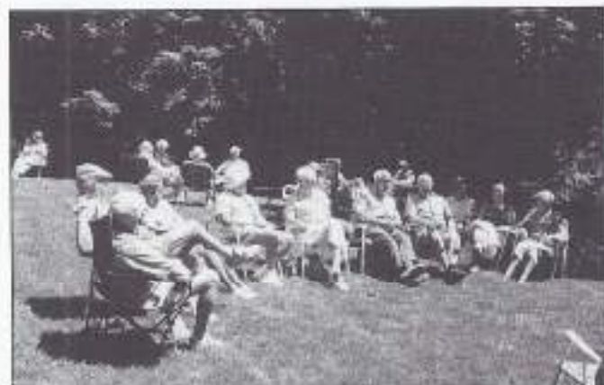
Picknick VOMF Canada.

Het is hier wederom een mooie, warme zomer en onze leden zijn druk in de weer geweest met het organiseren van districtsbijeenkomsten, welke meestal plaatsvinden in de vorm van een picknick.