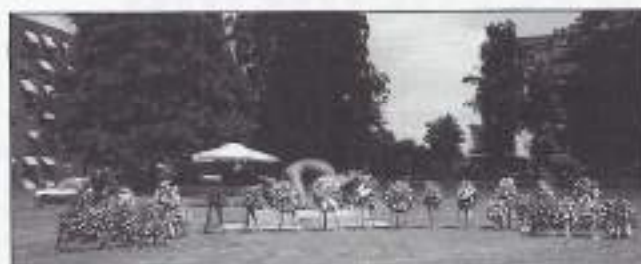
Kransen gelegd bij het Indië-monument te Enschede.

Een hoornblazer beëindigde de "één minuut stilte" met de "Last Post". Hierna werd gezamenlijk het 1e en 6e couplet van ons volkslied gezongen. Aansluitend hierop werden tientallen kransen bij het monument geplaatst, w.o. VOMI en S-S R.I., het Twents/Gelders bataljon.