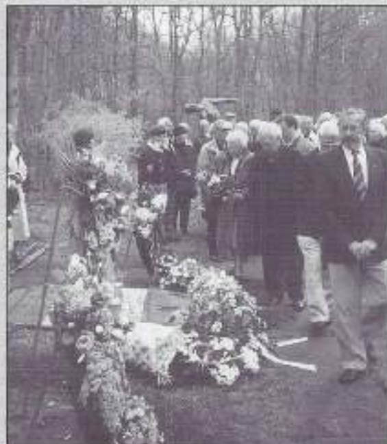
Monument voor de 14 gesneuvelde Velzer vrienden.