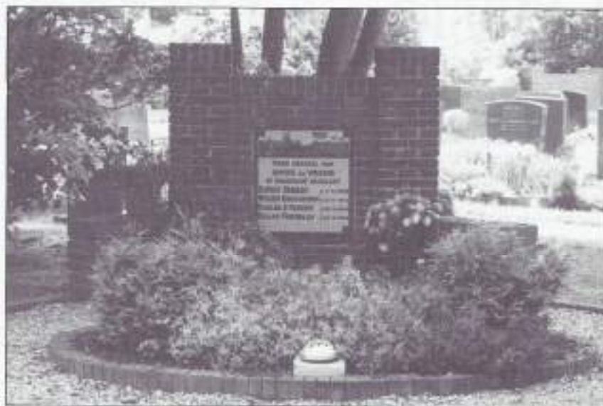
Monument op het kerkhof te Hippolytushoef.