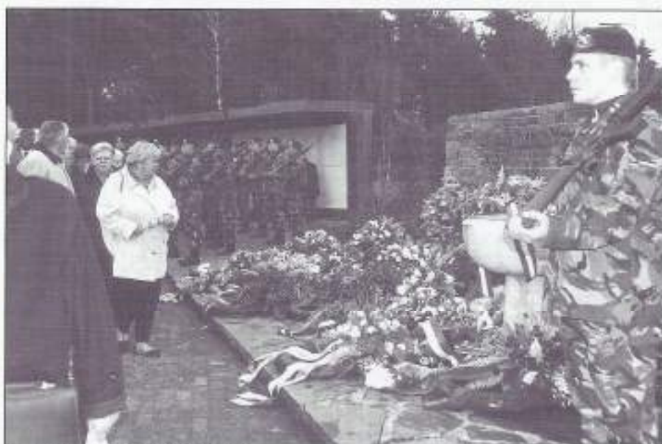
Bij het monument.

in Bosnië, Macedonië en Afghanistan, een bijdrage aan vrede, veiligheid en recht. Ze doen het goed en daar zijn wij allen trots op. Maar het geeft ons ook de verplichting om de overledenen van deze generatie jonge veteranen te herdenken. Ik kan me daar geen betere plaats bij voorstellen dan hier in uw midden. Ik besluit daarom met de wens dat u nog heel lang in staat zult zijn om onze jaarlijkse herdenking bij te wonen.