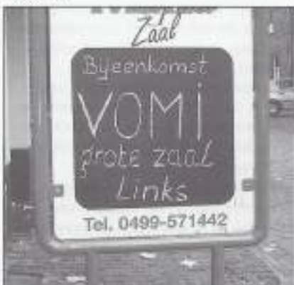
Op deze manier doen ze het in Oirschot.

Op 26 september hielden we weer eens een bijeenkomst in een kleinere gemeente. We hadden in zaal "Het Vrijthof" een goede locatie gevonden. Het was een schot in de roos, want de opkomst was boven verwachting groot en het werd een geslaagde bijeenkomst, waarbij we ook weer enkele nieuwe leden konden inschrijven. Het besef dat de opvallende plaatsen ingenomen moeten worden, is gelukkig toch duidelijk aanwezig. Gerrit Vink van het Veteraneninstituut kon ook deze middag weer een aantal mensen van dienst zijn met de "reparatie" van het Veteraneninsigne.