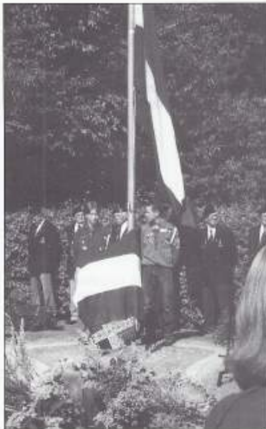
Het nog niet onthulde monument. Op de achtergrond een deel van de erewach. Achter het monument twee jonge personen.

genoegen". De officiële plechtigheid werd afgesloten door de Liemers Harmonie met het Wilhelmus