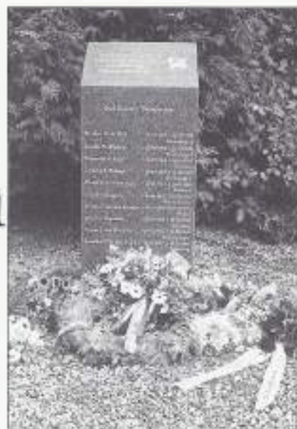
Monument te Oud-Gastel.

Door de wethouder werd er met een nabestaande het monument onthuld, waarna er twee minuten stilte volgde. Door de plaatselijke fanfare werden er twee strofen van het Wilhelmus ten gehore gebracht en werd er gelijktijdig door sobat Bierbooms de vlag in top gehesen. Hierna volgde een kranslegging door de wethouder met een nabestaande, bloemlegging door andere nabestaanden, VOMI Noord-Brabant West en overige aanwezigen. Aansluitend werd ieder in de gelegenheid gesteld te defileren langs het monument, waarna er een samenzijn door de gemeente Halderberge was georganiseerd in