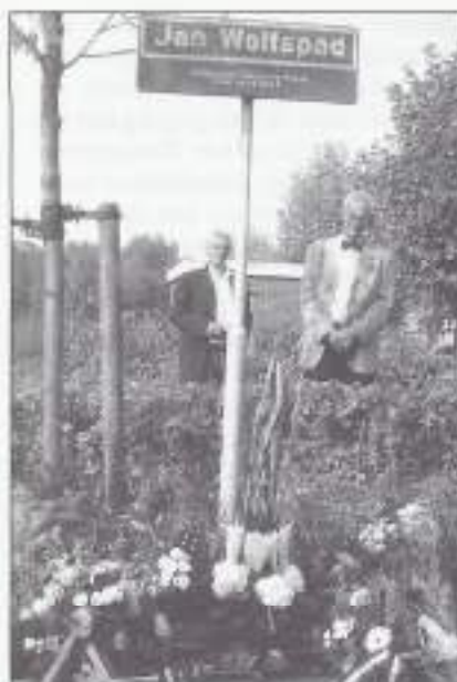
Onthulling van het Jan Wolfspad