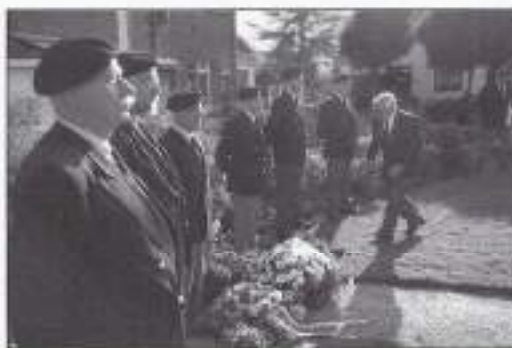
Kranslegging en erewacht.

De herdenkingsbijeenkomst werd mogelijk gemaakt door de belangeloze inzet van een heleboel mensen. Naast de bijdrage van alle bovengenoemde personen leverde de C1000 aan de Pieter Calandlaan de koffie, de thee en de koek en dichtten de