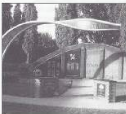
Het onthulde monument in Oss.

Op de avond van de Osse bevrijdingsdag werd in de Prof. Regoutstr. het monument, gewijd aan de burger- en militaire oorlogsslachtoffers, onthuld. Aanvankelijk zou deze onthulling uitgesteld worden, omdat het monument nog niet geheel compleet was. Drie van de zeven panelen met o.a. teksten van schoolkinderen ontbraken nog en ook de financiën daarvoor, ten bedrage van 8.000 Euro, waren nog niet rond. Na afloop werd echter de verheugende mededeling gedaan, dat het ontbrekende bedrag er nu toch was gekomen.