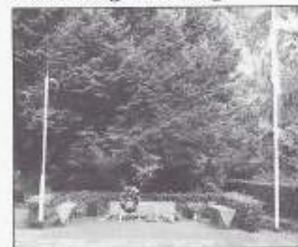
Het monument in Veghel

Op 27 augustus 2003 kwamen de Veghelse veteranen bijeen bij het monument van hun gesneuvelden. Het werd door de talrijke aanwezigen ervaren als een eenvoudige maar waardige herdenking.