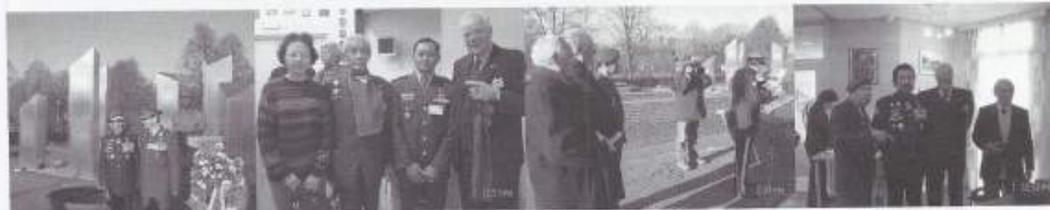
Generaal Soedarto (TNI) en Generaal L. Noordzij (Commandant 1e Divisie '7 December').