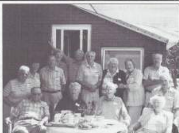
Gezellig samentzjn van sobats en hun partners.