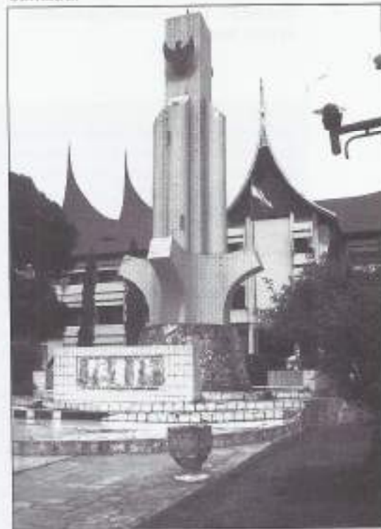
Het monument te Padang. (Zie voor verdere beschrijving onderstaande)

Met daarboven het opschrift: "Deze soldaten zijn hier gesneuveld tijdens de eerste en tweede actie" en daaronder: "Deze soldaten waren hier begraven". Daar achter een beeldhouwde sokkel met oorlogstaferelen met aan de achterkant de gegevens van de initiatiefnemers. Er moet op de sokkel nog een tweede tekst staan, gesteld in het Minangkabau, de taal die gesproken wordt in West-Sumatra.