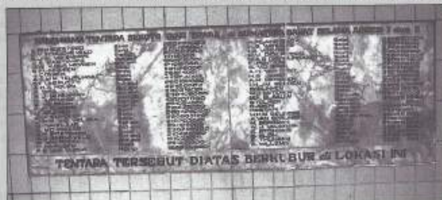
De plaat met namen van de gesneuvelden.

Deze soldaten waren hier begraven (Tentara Tersebut Diatas Berkubur di Lokasi Ini).