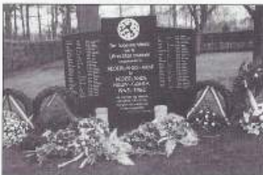
Het onthulde monument te Utrecht