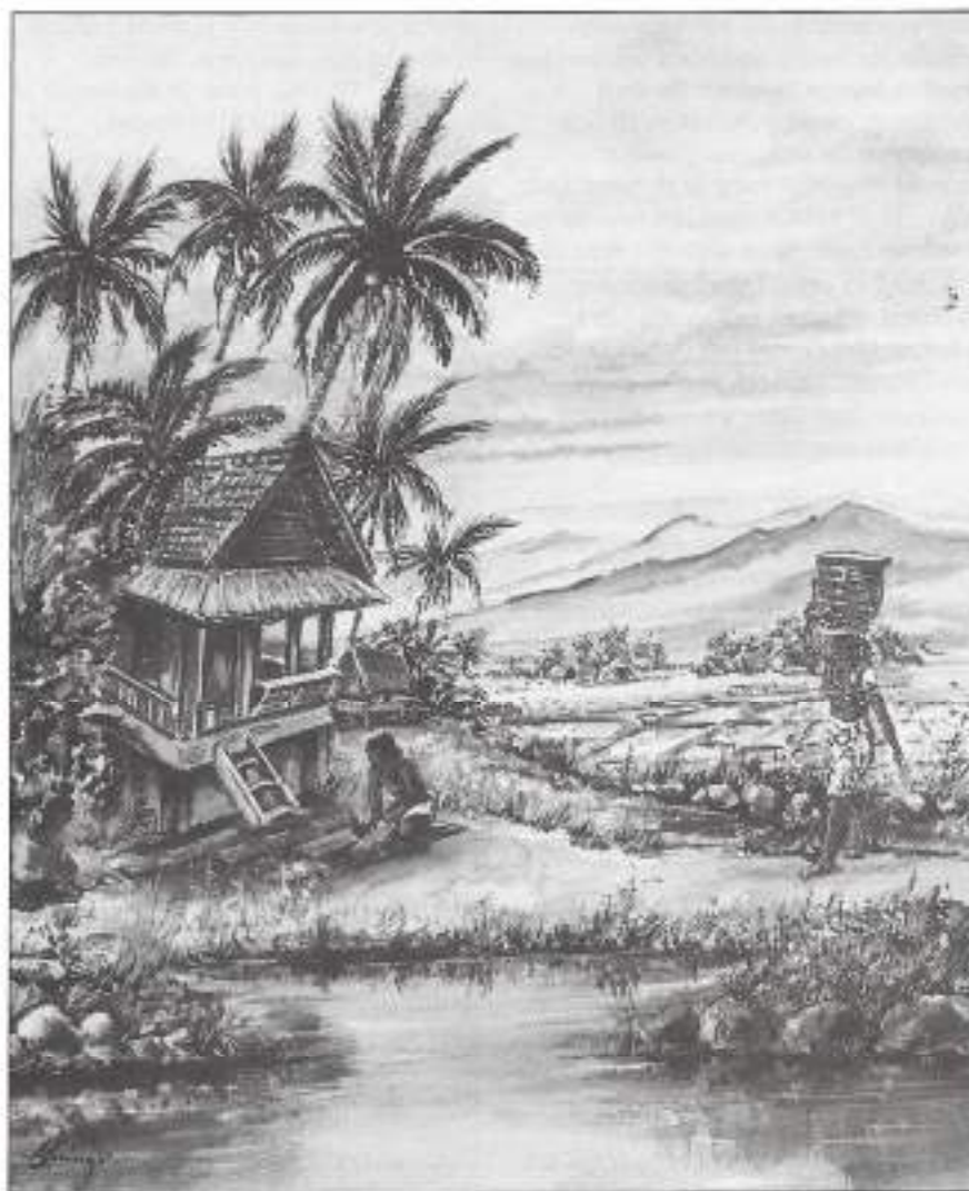
Stenendraagster op Ball, met acht zware plauwizen op haar hoofd. Ill. A.F. Koning.

Toen moesten wij ons opnieuw vermennen om verder te gaan: wij lie-