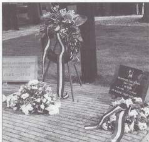
Onthulling gedenksteen op 27 maart 2004.