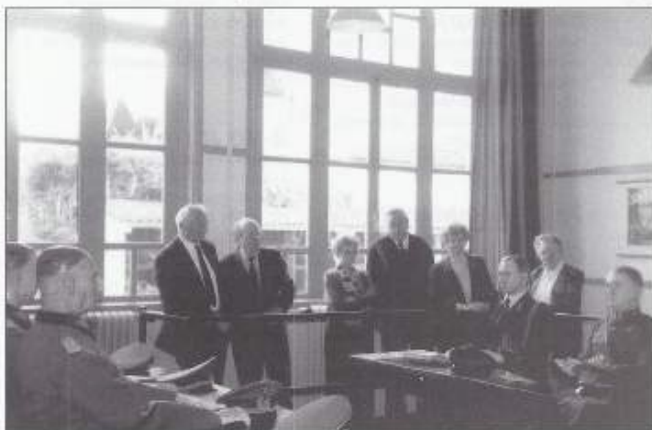
Het lokaal waar de capitulatie-overeenkomst op 15 mei 1940 werd ondertekend. Aan tafel de Duitse en Nederlandse officieren. De toeschouwers zijn enige bestuursleden van VONI Zuid-Holland Zuid met de echtgenotes.

knieën te krijgen door de stad Rotterdam te bombarderen. Dit geschiedde op 14 mei in de middag en het centrum van Rotterdam werd compleet van de kaart gevaagd ten koste van honderden doden.