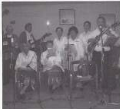
Molukse muziek- en dansgroep.