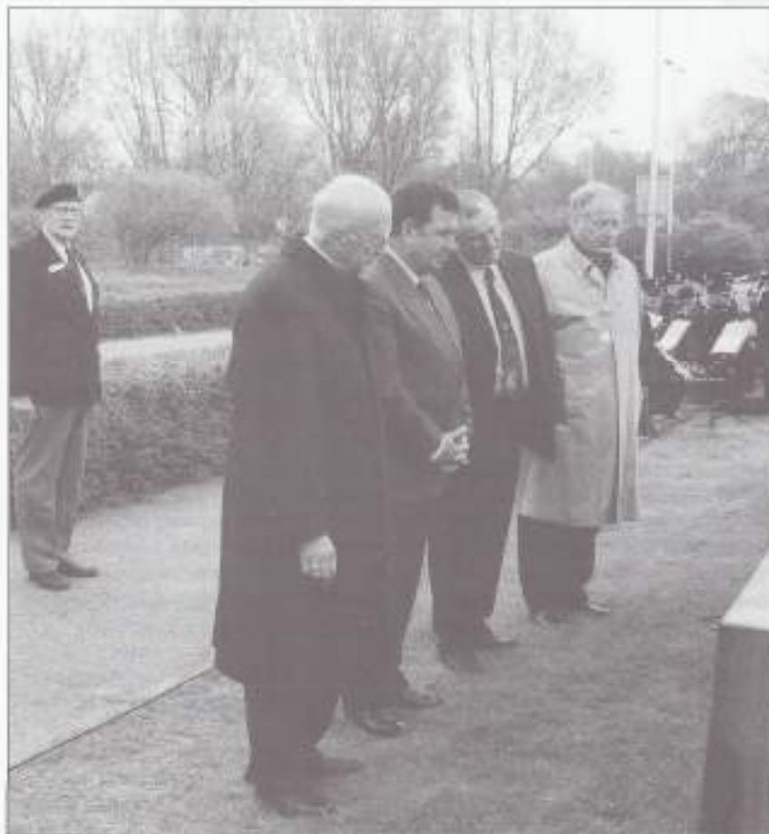
Burgemeester Deetman en nabestaanden van de gevallen bekijken het monument. Op de achtergrond de heer Topée.