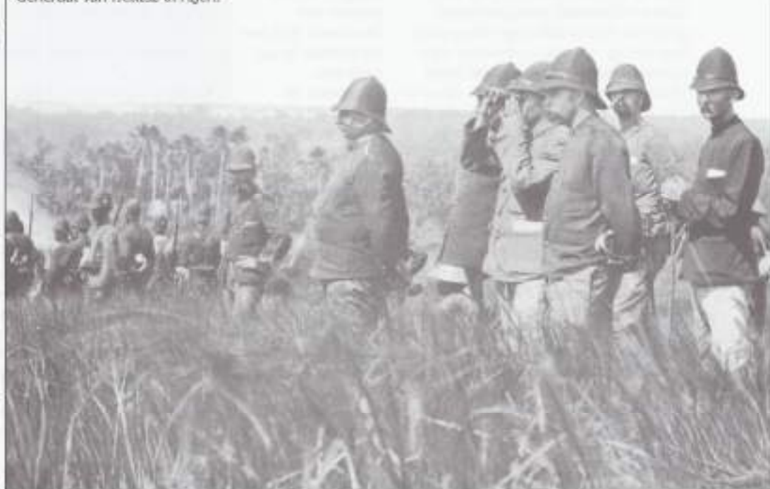
Generaal Van Heutsz in Atjeh.

een of andere reden niet kon slaan, dan zocht hij zijn weg naar het leger in Indië. Een prettig baantje was dit zeker niet, want er werd overal nog gevochten. Atjeh moest nog onderworpen worden, Borneo was nog onrustig, en in de gloeiende hitte deden deze mannen "hun werk". Het werk waarvoor zij geteekend hadden.