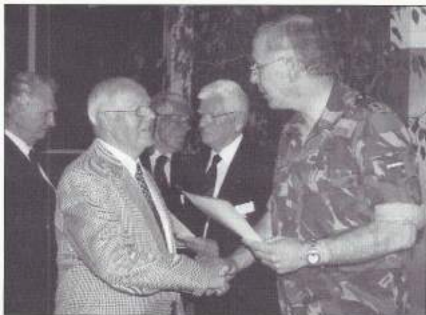
Met uitreiken van de oorkonde door Brigadegeneraal P.K. Smit.

VOMI-NL, dank te zeggen voor de steun, collegialiteit en vriendschap die ik vanuit alle geledingen heb mogen ontvangen bij de uitvoering van deze operatie.