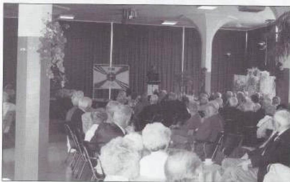
Met volle aandacht luisteren naar de speech.

Op het moment dat het bestuur van VOMI-NL vorig jaar samen met de besturen van de regionale VOMI-verenigingen besloot om toch invulling te geven aan de uitvoering van de Ministeriële Beschikking van 21 september 1998, kon niemand vermoeden hoe groot het aantal belangstellenden zou worden. Na de eerste mededelingen daarover in de 'Sobat' en in de 'Checkpoint' van december 2003 werd, aan de hand van de vele reacties, al snel duidelijk dat aan een goede zaak werd gewerkt. Maar dat het aantal de 1.500 verre zou overschrijden, hadden weinigen verwacht.