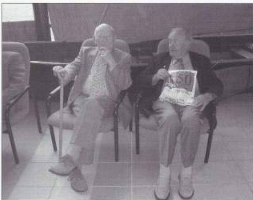
Melaas, de dag is weer voorbij.