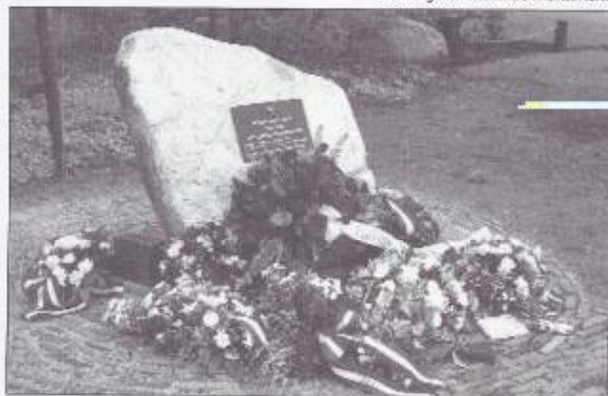
Het zojuist onthulde monument