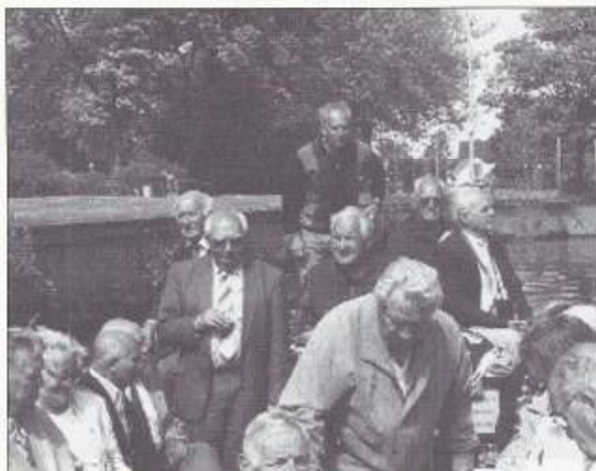
VOMI-leden Zuid-Holland Noord varen door het Westland.