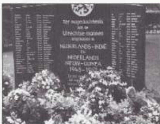
De gelegde bloemen bij het Indië-monument.

op verzoek van zijn vrouw en kinderen tijdens de plechtigheid als een Erewacht opgesteld naast de baar. Dit gaf het geheel een waardig karakter en er waren vele bloemen. Zijn hobby was het kweken van de Lathyrus en zijn verzoek was dan ook, als er bloemen waren, deze na afloop bij het Indië-monument te leggen, wat geschiedde.