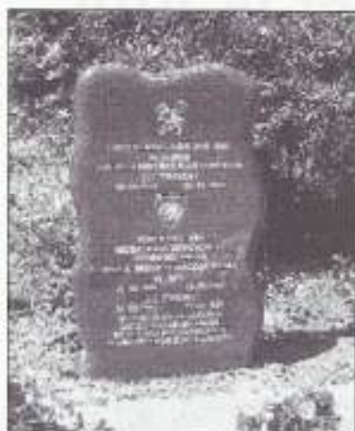
Gedenksteen in Brielle