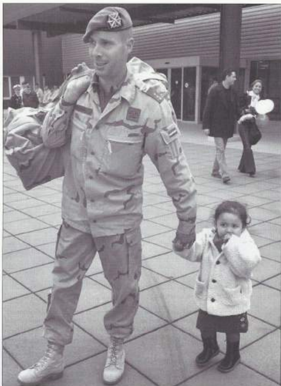
Jonge veteranen verdienen meer aandacht.

Er bestaat een scheiding van verantwoordelijkheden door het feit dat het Veteraneninstituut niet bij Defensie hoort. Toch heeft het instituut taken die met Defensie gerelateerd zijn. Het is daarom verstandig om de verantwoordelijkheid voor de zorg eenduidig bij Defensie neer te leggen. Het creëren van één frontof-