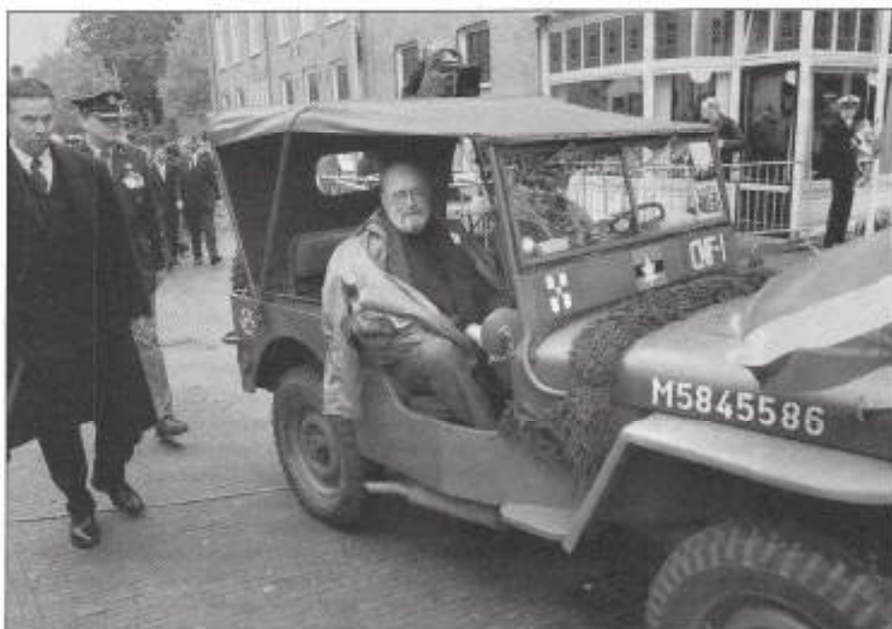
De Prins tijdens het Defilé in Wageningen.

Het was een levenslustige Duitse edelman die in 1937 kennismakte met het Nederlandse volk. Sportief en avontuurlijk, bereisd, met zicht op de grote wereld. Hij werd ingelijfd bij een hof dat toen nog een afgesloten bolwerk was, en een volk dat in zullen verdeeld de beslotenheid van de binnenkamer zocht.