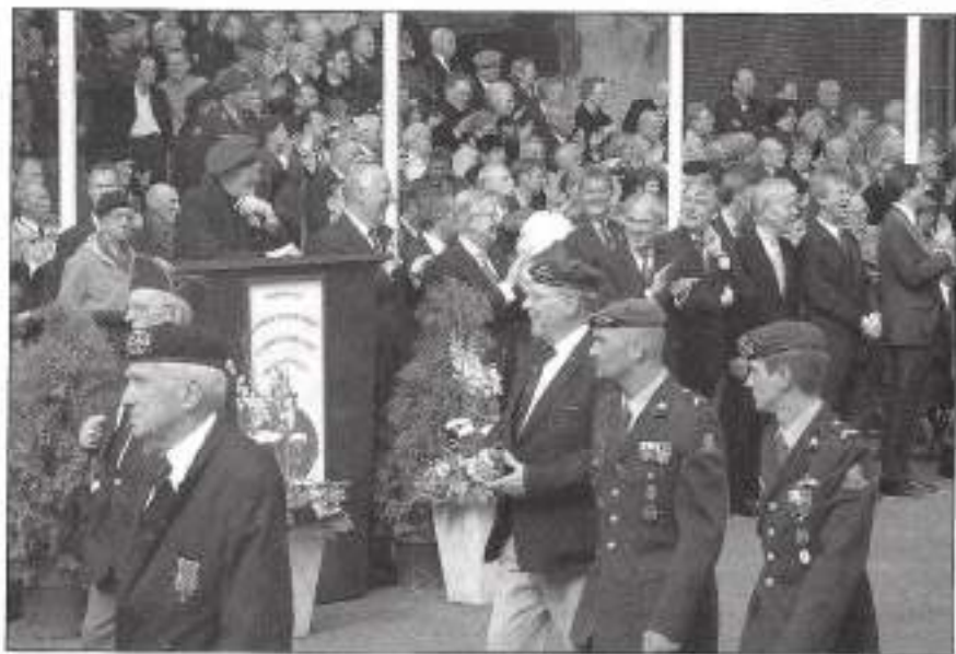
De Prins met groene baret.

Het compromis doet ook geen recht aan de mening van veel veteranen, zoals die uit de peiling van het Veteranen Platform naar voren is gekomen. Hopelijk kan er nog iets veranderen aan de nu voorgenomen opzet, hetzij via een uitbreiding van de doelstelling voor Wageningen, of via de invulling van de Landelijke Veteranendag op 29 juni.