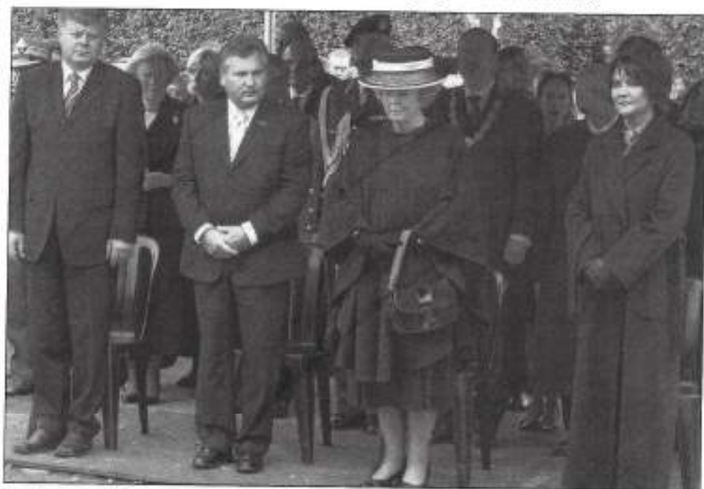
In gedachten tijdens gebed op de Poolse begraafplaats Etlensebaan, Breda.