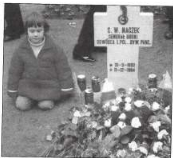
Poolse kinderen bij het graf van Ge. Maczek. Poolse Erebegraafplaats op de Etlensebaan.

zij in 1945 thuis (Polen) niet als bevrijder werden gezien, en verdere genodigden.