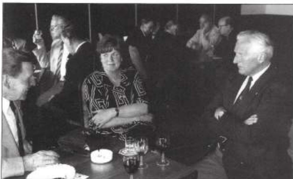
Regiobijeenkomst bij het afscheid van bestuursleden van VOMI Zuid-Holland Zuid.

Mevrouw Zijldwegt was vanaf het begin in de jaren tachtig van de vorige eeuw bij de start van het veteranenbeleid betrokken.