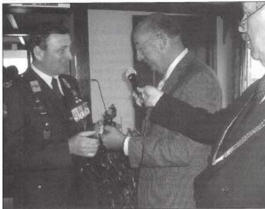
Aan boord van het schip "Zilvermeeuw" ontving generaal-majoor