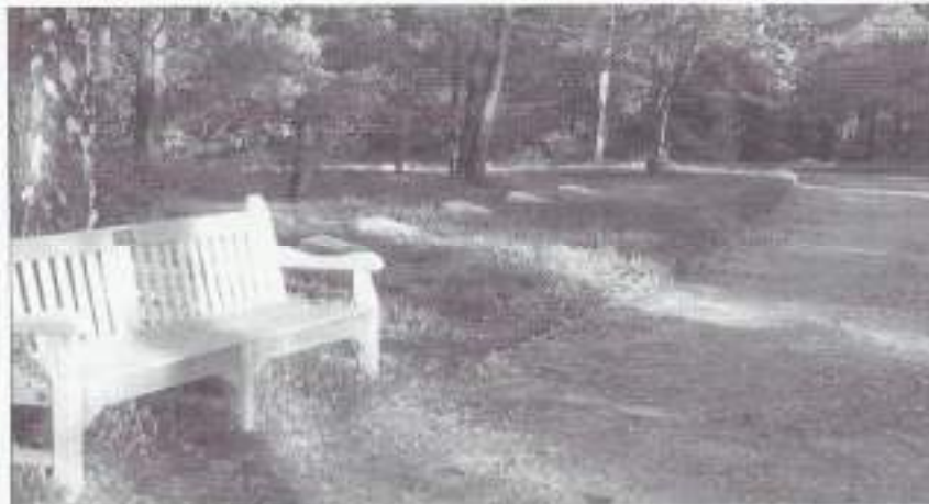
Nieuwe banken in Loenen

In Molkwerum, Nieuwegein, Akkrum, Blijham, Oldenzaal en Hengelo (Ov.) werden kleine geallieerde plots gere-