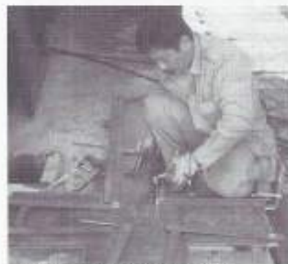
Stalen mallen voor betonnen kruisen in Indonesië

Het informatiecentrum op de Grebbeberg is verder ontwikkeld. De expositie is heringericht en er is een nieuwe brochure gemaakt, met steun van het Ministerie van Defensie. Op de Waddeneilanden werden voor het eerst sinds 1988 door medewerkers van de OGS samen met de Commonwealth War Graves Commission Texel, Vlieland, Terschelling, Ameland en Schiermonnikoog de geallieerde oorlogsgraven geïnspecteerd. Geconstateerd werd dat deze graven over het algemeen goed zijn onderhouden. Met name het groen is goed verzorgd. De schooljeugd wordt hierbij betrokken.