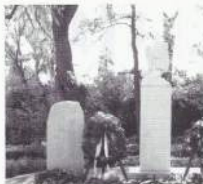
Monument te Leerdam