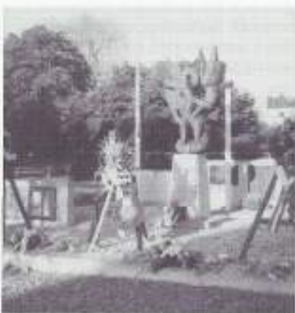
Monument te Oisterwijk