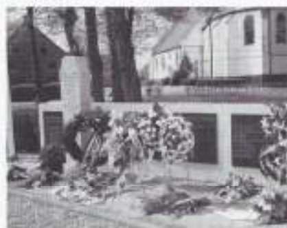
Het onthulde monument te Enspijk (Gem. Geldermalsen)