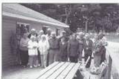
familie en picknick

Als u dit leest is deze 13e picknick al weer verleden tijd. Hopelijk werd aan alle wensen voldaan, gezien de situatie vorig jaar, toen het park niet optimaal benut kon worden.