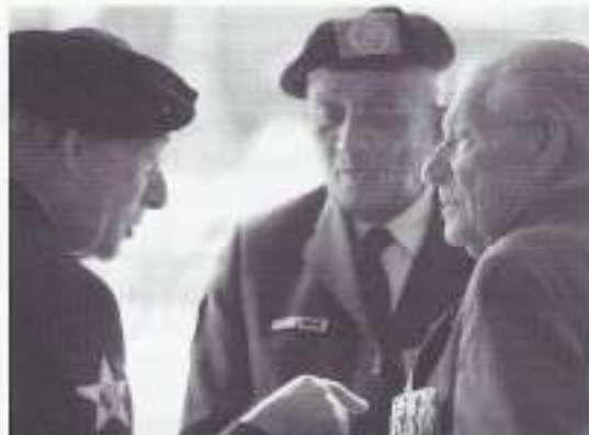
Veteranen samen vooraf aan het officiële gedeelte