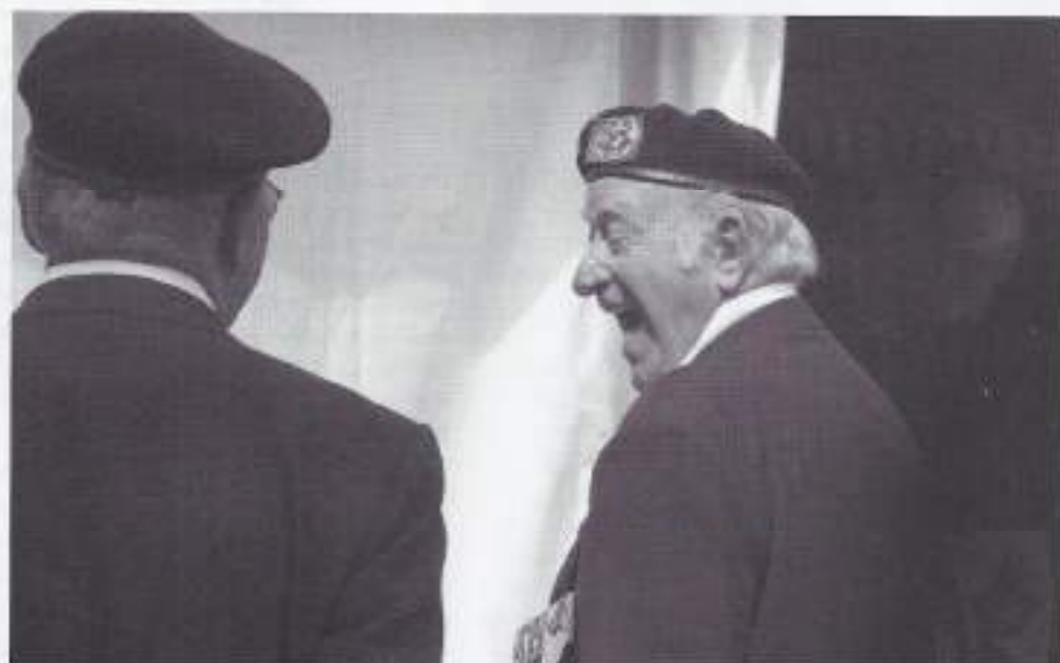
Veteranen komen in tent bijeen

Het eerste evenement in Den Haag was een plechtigheid die tussen 14.10 en 14.50 uur in de Ridderzaal werd gehouden. Tijdens deze plechtigheid werd door de Vice-premier en andere gastsprekers ingegaan op het respect dat veteranen verdienen. Tevens werd er aandacht besteed aan de slachtoffers die gevallen zijn tijdens de vele missies van de Nederlandse krijgsmacht. Voor deze plechtigheid gaven onder andere acte de présence Zijne Koninklijke Hoogheid de Prins van Oranje, de Vice-premier, de voorzitters en vertegenwoordigers van de Eerste en de Tweede Kamer en andere hoogwaardigheidsbekleders. Verder waren een honderdtal kinderen - die in het educatieve traject hebben meegedaan - en 300 veteranen aanwezig. Het geheel werd muzikaal omlijst door het Koperkwartet van de Marinierskapel der Koninklijke Marine.