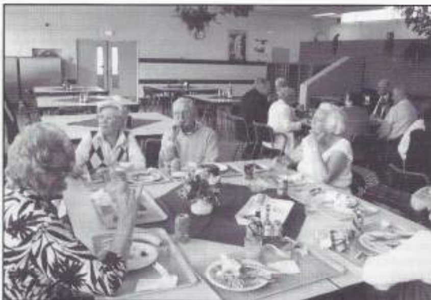
Het nuttigen van de rijstmaaltijd

Dan hebben wij nog een prettige mededeling voor onze VOMI-Veluwe sobats. Voor beide activiteiten, zowel op 12 oktober als op 24 november, worden GEEN bijdragen van u gevraagd. U krijgt alleen in het najaar nog een brief met nadere gegevens en antwoordstrookje, wat u moet invullen en retourneren. Dit is alleen nodig voor 24 november. Tenslotte wenst het bestuur van