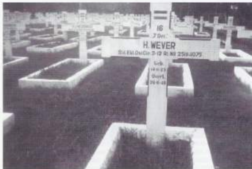
Dreeveld Menterig Pulu te Jakarta

Natuurlijk gaan we weer de sobats herdenken die in Indië zijn achtergebleven, maar het aantal doden en voor hun leven geschonden militairen zijn er veel meer dan de 6200 die wij in Roermond gedenken. Ieder van ons oude veteranen die dit lezen weet van sobats die gewond, ziek, geestesziek of door heimwee overmand, vroegtijdig zijn teruggestuurd. 4 December 1947 is onze AAT compagnie gewonden vervoer vanuit Rotterdam naar Indië vertrokken. In de golf van Biskaje kwamen we terecht in een fikse storm, zodat één van de militairen, groen van de zeeziekte, uit zijn kooi viel op de stalen vloer. Dit was de eerste zwaargewonde met een schedelfractuur. Hij is door een Engels marineschip in de baai van Gibraltar van boord gehaald. Toen we met ons schip, de "Sloterdijk" in Priok aankwamen was het weer raak. Twee van ons werden door de arts afgekeurd en met het vliegtuig naar huis terug gevlogen. De diagnose was heimwee. Na een paar maanden werd een sergeant teruggestuurd. Hij had last van zijn nieren, deze waren aangetast door een bacterie. Volgens de artsen zou hij het niet overleven. Ieder van ons kwam wel in het hospitaal om een