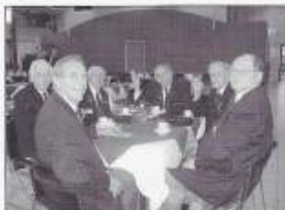
Gezellig aan de koffie en de spekkrook.

Na de toespraken kon er op meer informele wijze verder inhoud worden gegeven aan deze 4e lustrumbijeenkomst. Onder het genot van een drankje was het o.a. mogelijk de website van de VOMI ( www.vomi-nederland.nl ) te bekijken. Op deze bijeenkomst werden ook de nieuwe