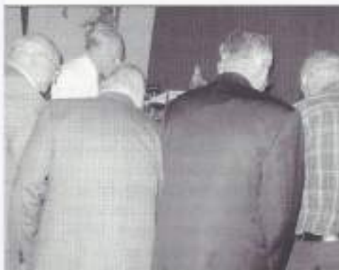
Drukte bij het boekenstalletje.

Na de vakantieperiode hielden wij in september een bijeenkomst in Boxtel. We hadden een andere zaal hadden uitgekozen die zeer voldeed aan onze verlangens, zodat de toekomstige bijeenkomsten daar weer zullen worden gehouden.