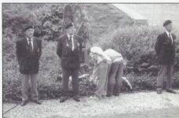
Leerlingen van de Technische school 'Het Gilde' plaatsen een roos bij het monument.

Op dinsdag 27 september j.l. vond de jaarlijkse herdenking plaats bij