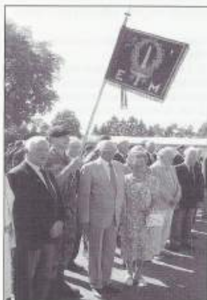
Een aantal veteranen bij het 'EM' Fanion.