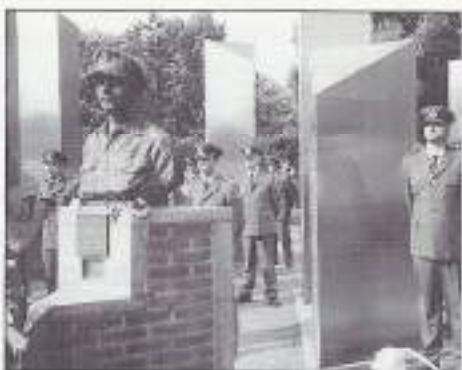
Erewacht van de Koninklijke Luchtmacht.