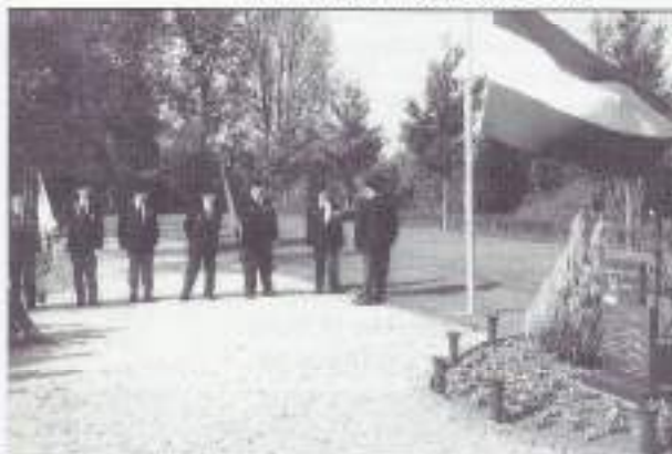
De erewacht van VOMI en Bond van Wapenbroeders opgesteld bij het monument.

Op woensdag 28 september j.l. vond een herdenking plaats bij het Indiëmonument op de Algemene Begraafplaats. Het was voor het eerst, tien jaar na de onthulling, dat er een herdenking plaats vond.