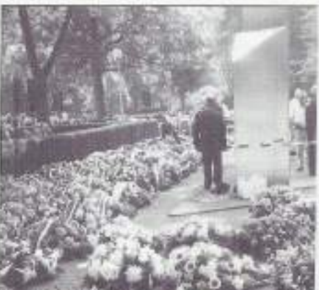
Een deel van de vele kransen en bloemstukken.

Daarna verliep de plechtigheid zoals we gewend waren, t.w. hoornsignalen, 1 minuut stilte, de fly-over van de luchtmacht, (altijd weer een emo-