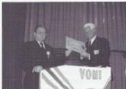
Orsel en Vis ontvangen waardecheque van Koninklijke De Swart.