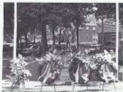
Kransen bij het monument in Dalen.