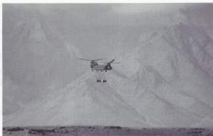
Transport door de lucht met de Chinook.

mij gemaakt. Over de sanitaire voorzieningen zal ik maar helemaal niets zeggen. Een gewonde agent met een gebroken been op het politiebureau kon ik blij maken met een paar paracetamollen. Ik had na terugkeer in ons kamp wel even wat tijd nodig om deze, ondanks alle voorbereiding, kennismaking met de dagelijkse werkelijkheid in Uruzgan te verwerken. Vervolgens dan weer hier in de eetzaal te zitten en te dineren met boerenkoolstampot met worst, is dan tegenstrijdigheid ten top".