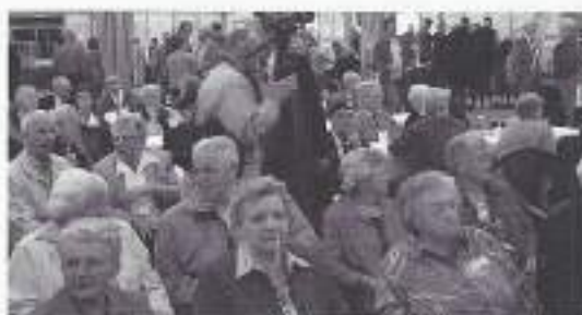
Goed gevulde tent.