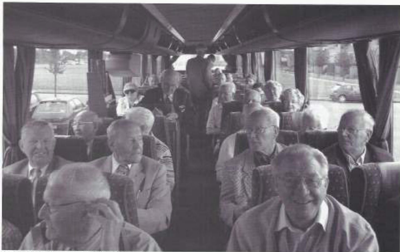
Een geslaagde dag (Zuid-Holland-Noord).