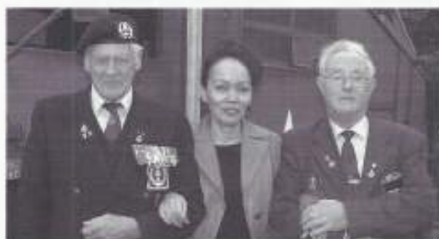
Oorlogsveteranen op hun gemak

tact op: telefoon 0343-474147 of e-mail info@veteraneninstituut.nl . Sedert 2004 participeren de districten, staf en opleiding-/kenniscentrum met elk maximaal 25 aspirant-veteranen in de veteranendag. Ze zijn ooit op vredesmissie(s) geweest, maar zijn nog in actieve dienst. Heel belangrijk is om deze nu al bij het veteranegebeuren te betrekken. Nieuw dit jaar is de deelname van het basiscontingent - zij die in voorbereiding zijn van hun (eerste) vredesmissie - van de Brigade Buitenland Missies. Info-desk projectgroep: reserve adjudant Bernard Maathuis, telefoon 055-5410443 of 06-51028506, of e-mail bgmaathuis@hotmail.com .