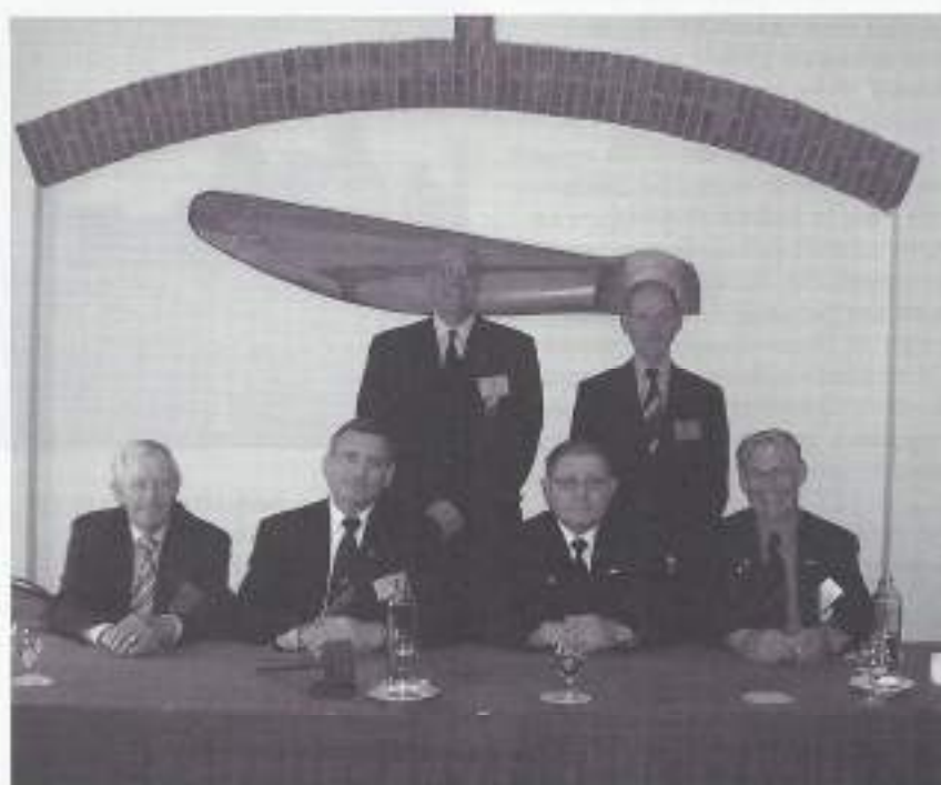
Bestuur VOMI NL.

VOMI-Noord-Brabant West heeft hierbij schriftelijk een kanttekening geplaatst.