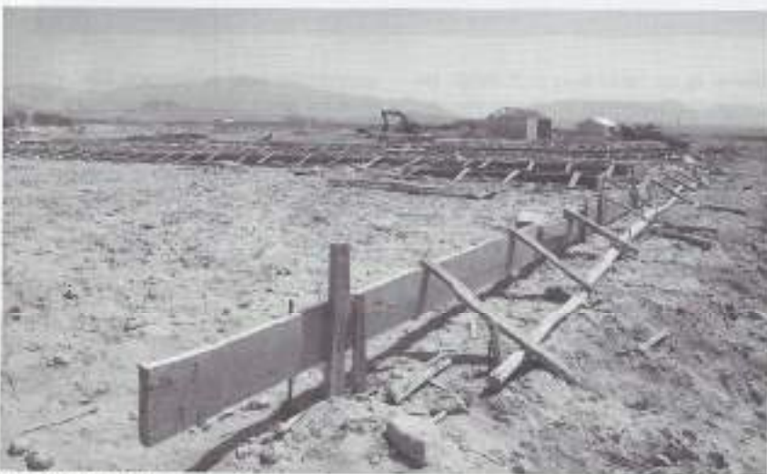
Het uitzetten van een nieuw gebouw.