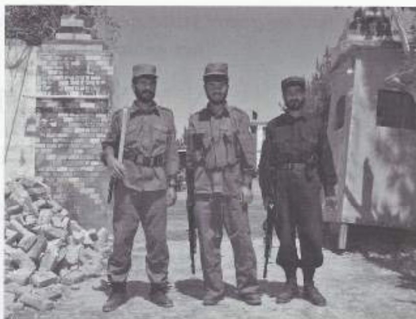
De opgeleide mensen.

Een van de belangrijkste taken voor ISAF in Afghanistan is het opbouwen van een sterk nationaal leger. De opbouw van de Afghan National