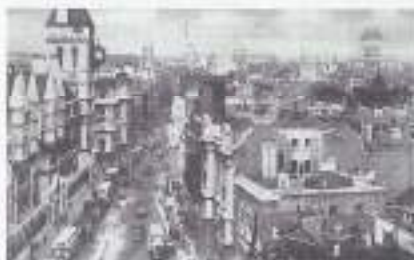
Royal Courts of Justice.

Ook daar alles bezet. Uiteindelijk komen we terecht in een ruimte 135 treden onder de grond, tijdens de oorlog in gebruik geweest als slaapplek. We slapen er goed ondanks de Canadezen die zo graag over hun verblijf in Holland vertellen. "Holland is a Paradise" zeggen ze maar we hebben zo'n slaap.