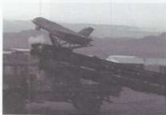
De RPV wordt gelanceerd.