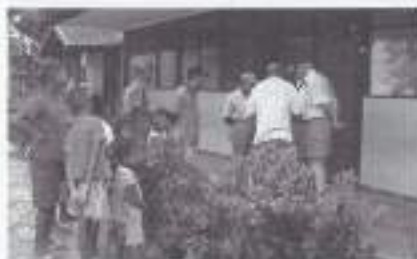
De school in Siabes.