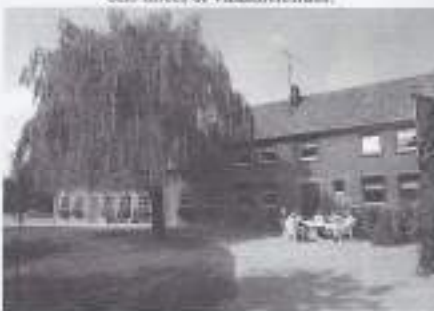
Inkelshoeve a gen Bongerd

Vakantiehuis tot 10 personen. Gehele jaar geopend!