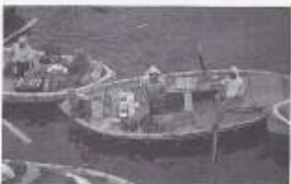
Port Said met de kooptui.

In de haven van Port Said. Echt verrassend is het uitzicht niet. Een artikel gaat naar de krant in de Alblasserwaard maar ik heb m'n twijfels of het opgenomen wordt. De stad is als een verzameling hel-witte blokken. Er volgt enig gemarchandeer met de kooplui in de bootjes. De goochelaar is indrukwekkend, in een mengelmoes van talen vertelt hij wat we moeten zien. Maar nog geen post uit Holland en evenmin kranten.