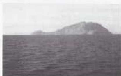
Het eiland Pantellaria.