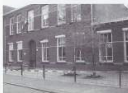
Het inloophuis vóór de opening.

VOMI Noord-Brabant Oost schonk bij deze gelegenheid een VOMI-vlag, een VOMI-schildje en een bedrag voor de verdere inrichting van het inloophuis. De voorzitter van de