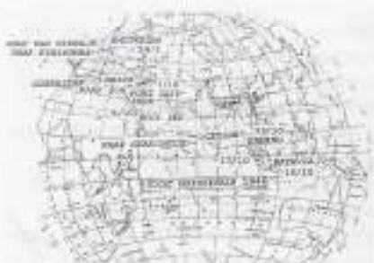
Tocht van de "Boissevain" 24/09 tot 19/10/46.