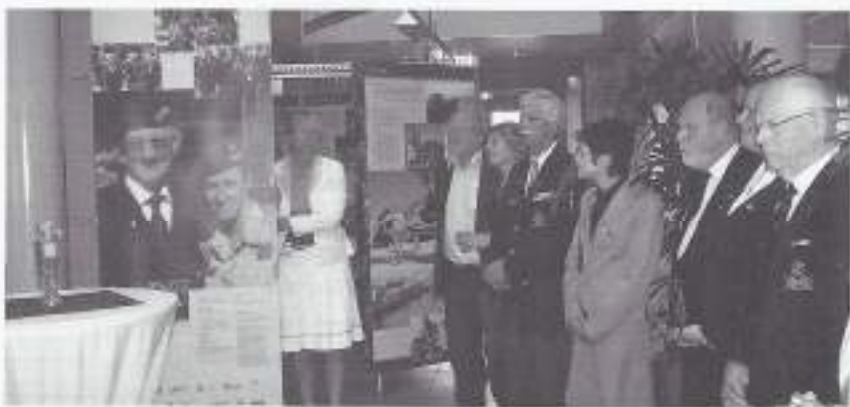
J.M. Een aandachtig gehoor.