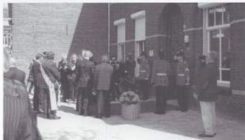
Het is zover: de deur gaat bijna open.

Wij van VOMI Noord-Brabant Oost spreken de hoop uit, dat ook de oudere categorie veteranen nog enige jaren gebruik zal kunnen maken van deze nieuwe accommodatie en dat deze van tijd tot tijd een afspraak zullen maken om elkaar in de Smitsstraat te ontmoeten. Let op: in de buurt "De Bergen" is een parkeervergunning voor belanghebbenden van kracht, zodat u uw auto niet overal kunt parkeren. Busverbindingen zijn: Lijn 3 naar Willemstraat en de lijnen 14, 15 en 150 naar Grote Berg (heel dichtbij). Voorlopig zijn de openingstijden op donderdag en zaterdag. Na een aanloopperiode wordt dit uitgebreid en aangepast aan de wensen van de bezoekers. Men zoekt nog naar vrijwilligers voor assistentie. Kijk eens op: www.stichtingveteranenbrabant-zuidoost.nl als u meer wilt weten.