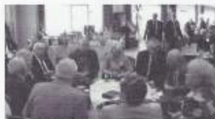
Gezellig bij elkaar

Dit was al weer de 13e keer dat wij in Oirschot deze grote reünie hielden en voor de 2e keer in de nieuwe Kempenzaal, waar de "kinderziekten" van vorig jaar snel vergeten waren. Het personeel had de zaal voortreffelijk ingericht voor de ± 325 deelnemers. Het waren er toch iets minder dan het vorig jaar.