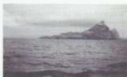
De rots van Gibraltar.

We varen door de zeestraat die de Atlantische Oceaan met de Middellandse Zee verbindt. Ten noorden zien we de omtrekken van de Rots van Gibraltar en ten zuiden het Hoogland van Tanger. Vandaar gaat het over "De Oude Wereldzee" pal naar het oosten. Tijdens "sloepenrol" moeten allen met zwemvesten om aantreden. We varen nu voor de kust van Noord-Afrika. Af en toe holt men naar stuur- of bakboordzijde om naar een school bruinvissen te kijken. Ook komen er dolfinen voorbij. Binnen 2 dagen passeren we Kaap Bon en het eiland Pantellaria.