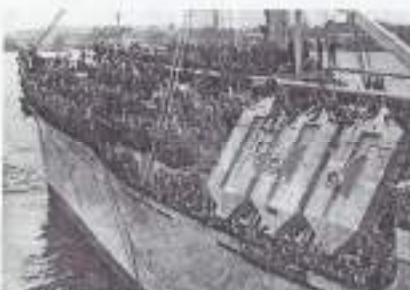
Vertrek van de "Boissevain" uit Amsterdam op 24 september 1946.