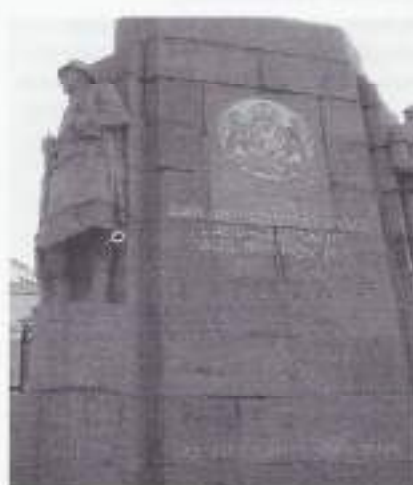
Monument te Scheveningen.

Na de mobilisatie volgde de concentratie, d.w.z. het in positie manoeuvreren van de troepen. Deze concen-