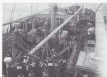
De sloepenrol in de Golf van Biskaje.