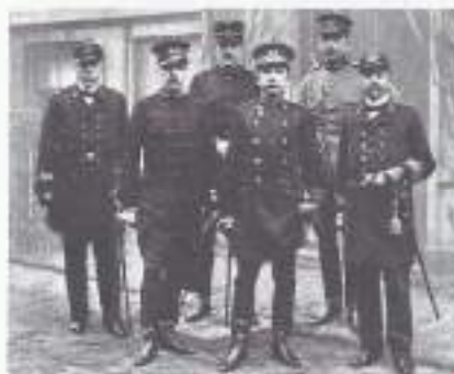
De staf van de Generale staf.

Op diezelfde 25 juli kondigde Oostenrijk een gedeeltelijke mobilisatie af, gevolgd door een algemene mobilisatie op de dag er na. Twee dagen later volgde de oorlogsverklaring aan Servië en een dag later vielen de granaten in Belgrado. Rusland steunde Servië en meende niet werkloos te mogen toezien en startte de mobilisatie op 30 juli. Op 31 juli oordeelde de Nederlandse regering dat een oorlog tussen Duitsland en Rusland spoedig zou uitbreken en besloot om 12.10 uur tot de mobilisatie. Duitsland had een verdrag met Oostenrijk en kon de Russische mobilisatie niet negeren. Op 1 augustus verklaarde Duitsland de oorlog aan Rusland en diezelfde nacht vielen Duitse troepen Luxemburg binnen om de spoorlijnen te bezetten die nodig waren voor troepentransporten en bevoorrading in het westen. Frankrijk was middels een verdrag verbonden met Rusland. Frankrijk reageerde op de Duitse mobilisatie met de mobilisatie van haar strijdkrachten. Duitsland verklaarde op 3 augustus de oorlog aan Frankrijk en deelde in de ochtend van 4 augustus, na een voorafgaand ultimatum, België mee dat Duitse troepen uit "veiligheidsoverwegingen" het kleine land zouden binnentrekken. Hierop werd de mobilisatie in Engeland afgekondigd. Op 23 augustus verklaarde Japan de oorlog aan Duitsland. Engeland, Frankrijk en Rusland (Entente) verklaarden de oorlog aan Turkije.