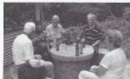
Hier wordt overleg gepleegd.