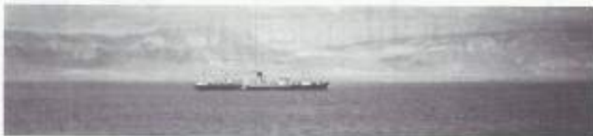
De Schelfzee, deel Suezkanaal.

We vervolgen onze weg door het Suezkanaal en ontmoeten oorlogsbodems waaronder een vliegdekschip: de "FORMIDABLE" met namen op de commandotoren: TIRPITZ 1944, Kaap MATAPAN en TOKIO 1945, plaatsen waar het schip in actie is geweest. Het dek staat vol met wulvende Tommies met hun duim naar het noorden. Maar wij varen de andere kant op! Het kanaal biedt uitzicht op een woestijn met hier en daar een palmboom. Elders volgt het schip een vaargeul door meren. Zo passeren we in de nacht het BITTERMEER, een glimmende spiegel met daarboven de maan in het eerste kwartier. Via de scheepsradio wordt de plaats aangegeven waar de Joden tijdens de vlucht uit Egypte door de Schelfzee trokken. Daar is de (schelf-)riet zee 20 km breed. Details uit het Bijbelverhaal worden daardoor aannemelijk. Verderop wordt de berg Sinai aangewezen. De zonsondergang met schitterende kleuren is als een plaatje uit 1001 Nacht.