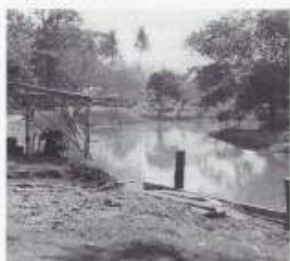
De rivier de Tjiluwong, kamp Ketapang.

M'n brieven worden getypt op Japans papier dat men overal aantreft. Het resultaat is slecht. Hier en daar ziet men Indiërs van de Britse bezettingsmacht. Ze voeren bij flikkerend avondlicht sabeldansen uit. Men wordt aangeraden geen contact te zoeken want ze schijnen moeilijk te zijn in de omgang. Hier en daar ziet men een rood-witte vlag van de TNI. In de kazerne voelen we ons rijk met de prettige hulp van djongos en baboe. De laatste zei steeds bij het vertrek: ANNIE KOMBALJE. We dachten dat ze zo heette, ze lachte maar wat. Ze zei gewoon dat ze terug zou komen. De figuur van Van Mook is beslist niet