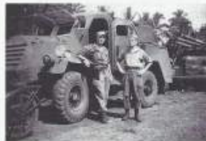
Met de GMC 104 onderweg.

Er is een voetbalwedstrijd tussen officieren en onderofficieren. Uitslag 4-3. Dan vervaagt de scheiding tussen de boven- en onderlaag. Die scheiding overigens is historisch gegroeid en internationaal.