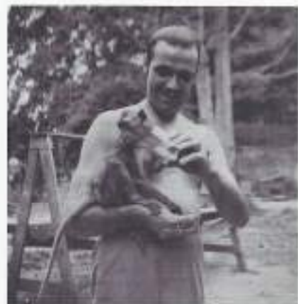
Vialle met aapje.

gens mij elders, in Engeland en Amerika: De archipel is voor die landen een aantrekkelijk gebied. Een neef logeert af en toe in Hotel des Indes, een oase van rust en luxe. Als boordwerktuigkundige heeft hij een schitterend uniform waarbij mijn Amerikaanse werkpak schril afsteekt. De KLM vliegt 4x per week naar Batavia met beroemde vliegtuigen als Skymaster en Connie. Met Kerstmis is er een dag geen post omdat het vliegtuig volgestouwd was met kerstbomen, zo men zei.