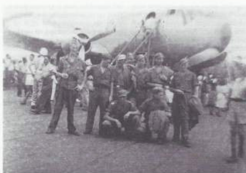
Op excursie naar het vliegveld Kemajoran.