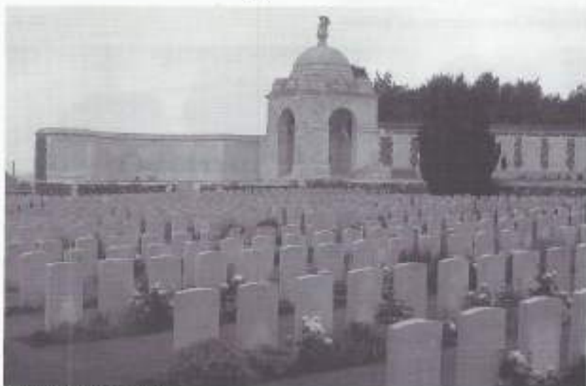
Tyne Cot Cemetery.