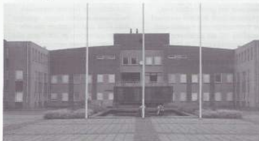
Vooraanzicht Engelbrecht van Nassaukazerne.