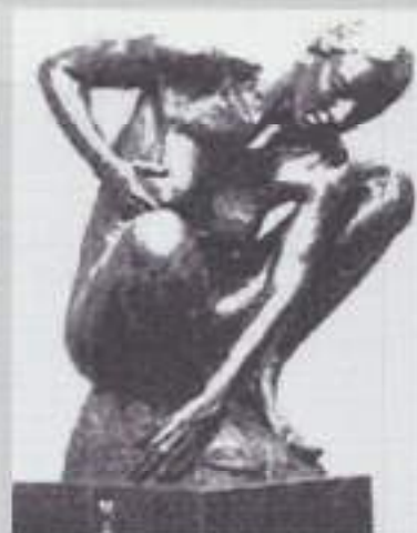
'De Wachtende Moeder'

De Stichting Indië Monument te Deventer houdt in samenwerking met de Stichting Masohi een herdenkingsbijeenkomst op vrijdag 15 augustus 2008 bij het Indië Monument 'De Wachtende Moeder'.