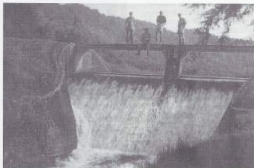
Bij een stuw op excursie.