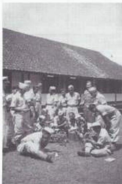
De Politie-school te Soekaboemi.

Een artikel over de regimentsseiners voor het Genie Gedenkboek wordt ingeleverd. In de GMC-104 gaat het naar het zuiden, richting Sindangbarang. Duizenden vlinders komen in wolken over de weg. Wat is dit een prachtig land.