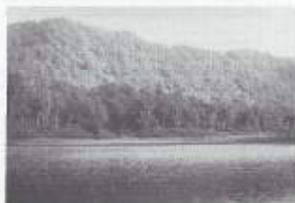
Meer bij Goenong Boerangrang.