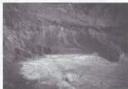
In de krater van de Tangoeban-Prahoë.

Op 5 juli weer naar Garoet, een stad die voor het moment Genie-stad heet. Er staan sierlijke poorten. Die in Tjimahi mist volgens sommigen de nodige uitstraling. Op 9 september gaan we met een groep van de Park naar de Tangoeban-Prahoë. Op de kraterbodem liggen veel steenbrokken, daarvan maken we in letters van 3 meter PARK-GENIE. Vanaf de kraterrand hebben we een prachtig uitzicht over de hoogvlakte.