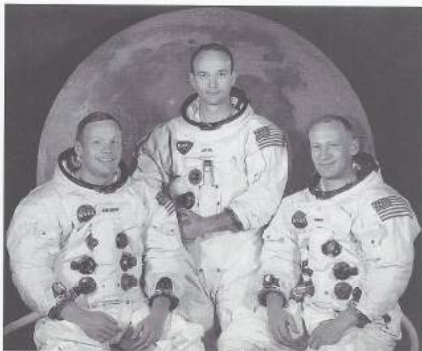
V.l.n.r.: Neil Armstrong, Michael Collins en Edwin "Buzz" Aldrin.

Precies op tijd scheidde de Eagle zich van de Apollo 11; het overgebleven deel vervolgde zijn tocht onder de naam Columbia. De bemanning