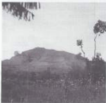
De Goenong Bohong.

4 oktober ben ik te Soekaboemi. In de mess wordt me met overtuiging gezegd dat ik de BESTE haan heb van het bataljon. Dat kan ik beamen. Half oktober weer in die plaats. Daar hoor ik spreken over het Tentara Soesoe, waarmee onze divisie wordt bedoeld. Tentara Soesoe: Het Melklegert. De bevolking van West-Java weet niet wat ze aan ons hebben, men wenst voor alles zekerheid.