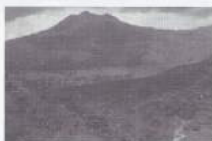
Langs de weg naar Garoet.

Er ontstaat een nieuw radio-net rondom Cheribon en de rels voert ons daarheen. Een andere rit leidt ons via Poerwakarta en Soebang naar Soemedang met langs de weg de Genie aan het werk. We hebben altijd haast dus contact is er spijtig genoeg niet. Te Soekaboemi koop ik een schitterende reliëf-kaart van Bandoeng en omgeving. Een museumstuk dat onbeschadigd uit de oorlog is gekomen. Ook de overste heeft interesse en na enige tijd verhuist de kaart naar zijn bureau.