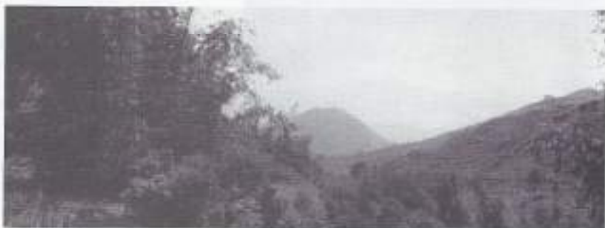
De Nagreg pas.

Een goede tijd breekt aan. Met de club van Kleinepiet beklimmen we de Goenong Bohong. Ook andere heuvels worden bedwongen. De weg erheen leidt door een serie kampongs in het weelderige groen. Aan dit land verlies je snel je hart.