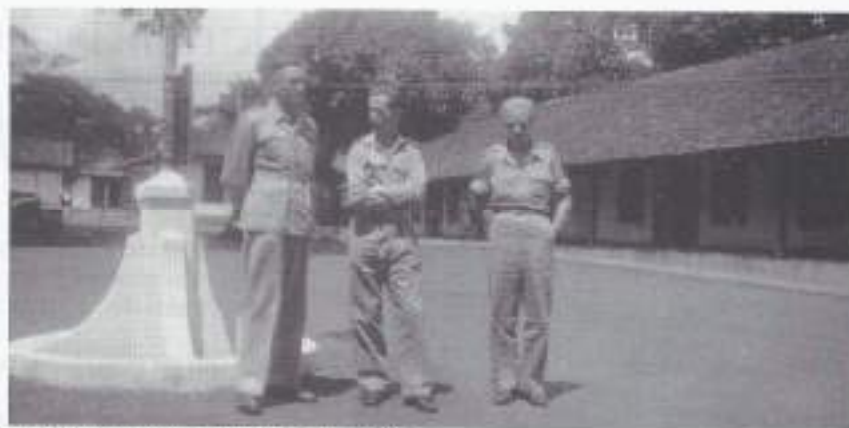
Met mannen van de Palmboom Divisie.