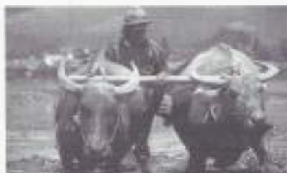
Sawah met karbouwen.

Het is intussen februari en de stemming onder de militairen daalt.