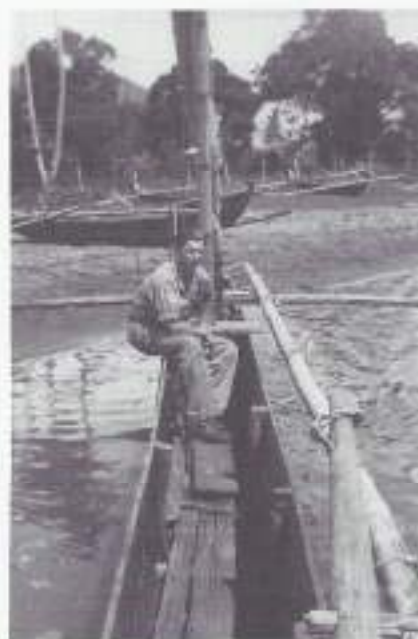
Korporaal Vrouwen bij de Wjnkooopsbaai.