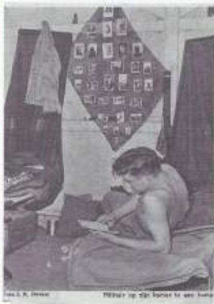
Een soldaat op zijn tempal.

De kledingsituatie onder de bevolking is erbarmelijk. Omdat ze de rijst van het Rode Kruis niet willen missen, komen ze vanuit de kampongs naar Serang. In groepjes langs de weg, kleren aan flarden. En dat bij die keurige, in-nette mensen als de Soendanezen zijn. De vroegere beambten van de Republiek keren eveneens terug, hen wordt geen strobreed in de weg gelegd. Een assistent-wedana onder de Republiek vraagt ons om zijn salaris. Hij spreekt dat wat langzame maar correcte Nederlands. We kunnen hem niet helpen.