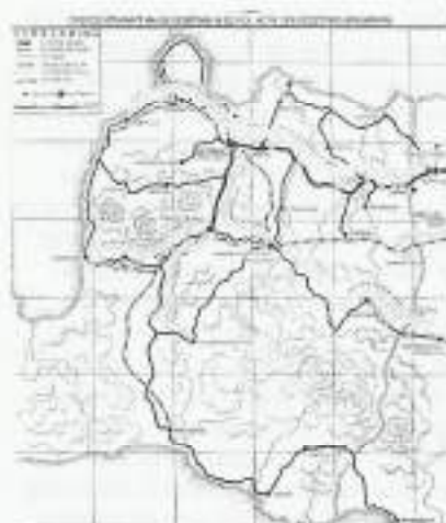
Kaart van de Tweede Politie Actie in Bantam.