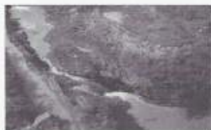
Stroomversnelling in de bovenloop van de Tjitaroem.

Op 21 januari ben ik te Tjimahi terug. Heerlijk koel, terug naar mijn kamer, de radiospullen en ook de sterrenkijker. Er wachten nieuwe stapels tijdschriften bestemd als lectuurgranaten voor de buitenposten bij Garoet. Alle brieven en pakjes worden door mij beantwoord. Op de kamers hoor ik de verhalen van de soldaten en hoe die de actie beleefd hebben. Of ze van afkomst links of rechts zijn, ze zijn het eens met de acties. Ze zien immers de resultaten. Maar voor alles willen ze naar huis. In Holland wacht hen de familie. Men is al veel langer op Java dan door de regering toegezegd. Bovendien is het door het extreem lage daggeld en de minderwaardige kleding een pover bestaan. Slechts een enkeling wil hier blijven, waaronder ikzelf. Anderen denken aan emigratie naar Australië of Nieuw Zeeland.