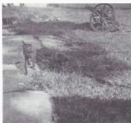
Een aap op de aloon aloon te Serang.

Ik was nog in Anjer Lor aan de westkust, een prachtig uitzicht over Straat Soenda met de resten van de beruchte vulkaan de Krakatau. Wat is dit land mooi!