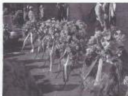
Meer dan 100 kransen werden gelegd om de sobats te gedenken, die in Indië het leven lieten.

Zoveel sobats willen zo graag vertellen aan de mensen, die er niet bij zijn geweest en willen hun verhalen kwijt over hetgeen zij hebben meegemaakt. Deze vreselijke strijd, mag nooit worden vergeten! De strijd, die werd gevoerd door jongens, die amper ooit een andere plaats hadden gezien binnen Nederland. Opeens moesten zij op bevel van de Nederlandse regering met 120.000 man de rust herstellen in het verre Indië. Een taak, waar de soldaten nauwelijks of niet op waren voorbereid. Een schier onmenselijke taak in een vreemd ondoordringbaar land, dat zo volslagen anders was dan hetgeen zij waren gewend. Vele sobats willen hun verhaal met overtuiging kwijt, anderen houden hun mond en zijn moe gestreden. De Nederlandse Regering weet wat er is gebeurd. Maar actie doofpot is nog in volle gang.