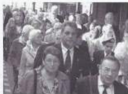
Drommen mensen uit één van de vele extra treinen, die op station Roermond aankwamen.

Naast mij op de tribune, zaten aan weerskanten van mij twee sobats van net in de tachtig. Ze riepen halfluid: "Doe er dan wat aan!" En ze kregen bijval van enkelen, die het ook hadden gehoord. "Laat onze strijd, die een eerlijke strijd was, niet ons het gevoel geven, dat we daar hebben lopen moorden!". Waarom nooit een lesbrief uitgegeven op de scholen over de dubbele moraal van de Nederlandse Regering. Dubbel, omdat er enerzijds gevochten moest worden voor Koningin en Vaderland en vervolgens keerden de sobats met hoongelach terug uit Indië, waar ze in een totaal andere wereld moesten doorgaan met hun leven. Hierbij geen troostende en zalvende woorden van koningin dan wel ministers. Nederland had geen tijd voor hen. Al hun krachtsinspanningen werden onder het vloerkleed geveegd. Mijn buurman verhaalde trots het verhaal, hoe enkele Limburgers bij elkaar zijn gaan zitten en tot de oprichting waren gekomen van wat nu heet het Nationaal Indië-monument 1945-1962. Dit monument wordt gedragen door het volk, want het is van het volk!