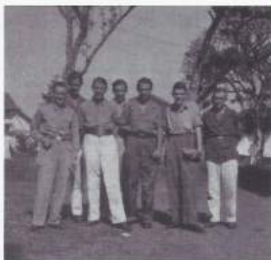
Op weg naar de kerk.

De Park gaat per 3/9 op de boot, het overige bataljon van oktober tot december.