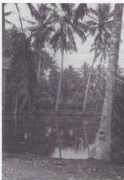
Tjimahi bij Bandoeng.