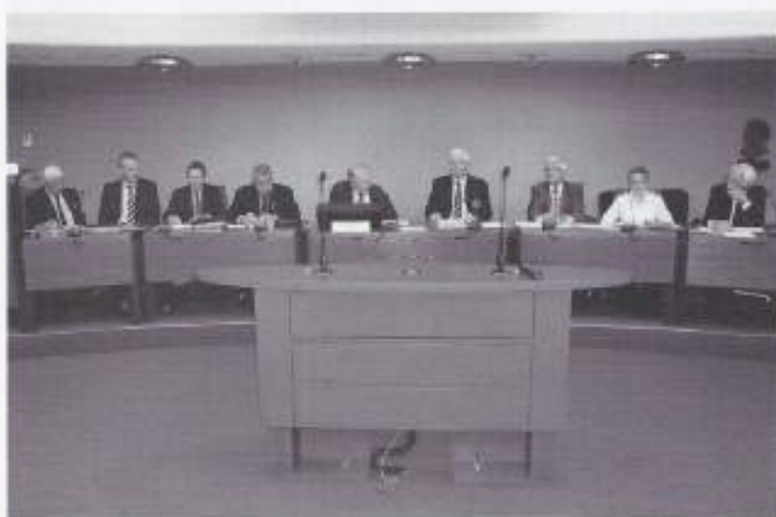
Achter de bestuurstaafel:

Daartoe behoren in 2010 de herdenkingen in Groesbeek en Holten en de defilés in Wageningen en Apeldoorn. Naast de entrees wordt het vervoer visa versa door TYCAF geregeld. Dat geldt evenzo de transfers voor de verwachte 3500 luchtreizigers vanaf Schiphol naar de gastgemeenten en terug. Deze laatsten alleen indien ze bij het NCTYC&AF zijn ingeschreven.