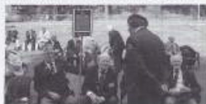
Ook Nieuw-Guinea-veteranen herdachten hun omgekomen strijders.

En dat was ook dit jaar weer te merken. De NS had extra treinen ingezet en de sobats werden in Roermond zoals altijd gastvrij onthaald. Een jonge politieagent schatte het aantal toch wel op ruim 20.000. De mensenmassa stond rijndijk tot buiten het park op de afgezette Maastrichterweg naar de plechtige herdenking te kijken. Een waardige en indrukwekkende herdenking, waarbij meer dan 100 kransen werden gelegd. Het mooie en bijna windstille weer droeg zeker bij tot het welslagen van deze dag. Na één minuut stilte voor de sobats, die zijn omgekomen in de strijd, vloegen weliswaar vier F-16 straaljagers laag over het monument in de formatie missing man . Het geronk van de machines deed bijna onwerkelijk aan. Dit was de hommage aan hen, die in Indië waren gevallen voor hun koningin, zoals dat toen nog heette.