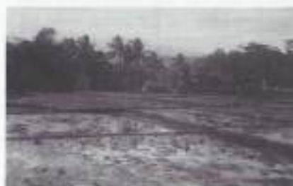
Een sawah landschap (West-Java).

Het leven in Tjimahi juli 1949 gaat zijn gewone gang. Een parade voor de nieuwe officieren en de gedecoreerden is voorbij. Alle radiospullen werden geïnventariseerd en gereed gemaakt voor overdracht. Daarvoor werden Soerakarta (Solo), Soebang en Garoet bezocht. Het materiaal wordt daar nog alle dagen gebruikt. Het moment nadert echter dat alles in andere handen over gaat. Vooreerst dus in federatieve handen, maar voor hoe lang?