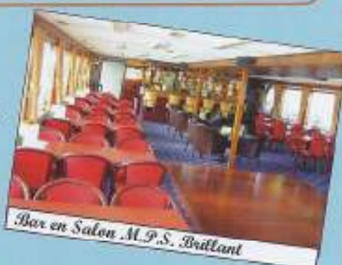
Bar en Salon M.P.S. Brillant

Nieuwe vakantie seizoenen bezorgen velen de kriebels. Dat is ook het geval bij BTR International River Cruises, die voor de komende vakantieperiode een fors aantal riviercruises voor u heeft gepland met het eigen cruiseschip M.P.S. Brillant. U wordt door gezelligheid en sfeer omringd. Het passagiersschip is namelijk gedeeltelijk gerenoveerd en vernieuwd en dat heeft tot gevolg gehad dat ontelbare cruiseliefhebbers hun (voordelige) cruisevakantie bij BTR International River Cruises boeken.