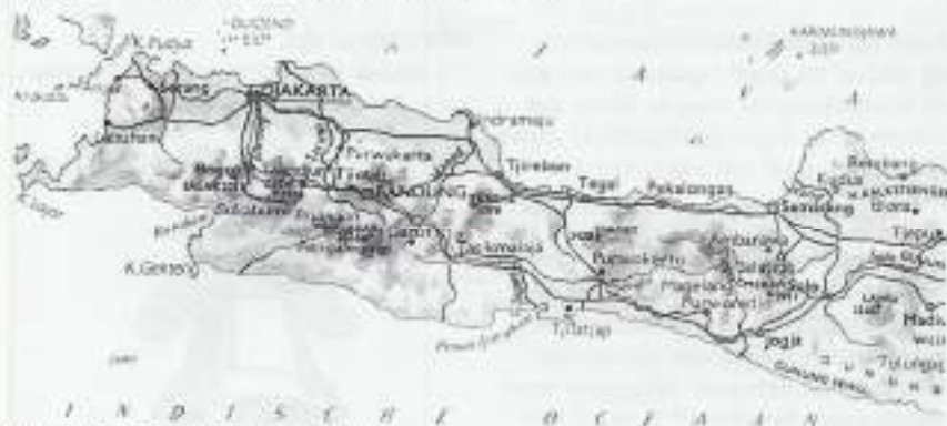
Overzichtskaart West- en Midden-Java.

In West-Java uitbundig groen. Midden-Java kent veel droge gebieden, is dus minder aantrekkelijk. Maar ik heb belde landstreken gezien