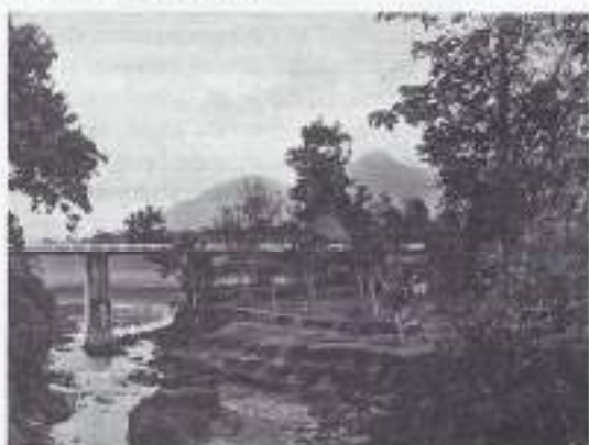
Gezicht op de Salak en de Gedeh.

4 september woon ik zelfstandig in een garage met aparte slaapkamer aan de Blitarweg te Batavia. Het middageten gebruik ik bij de familie/hoofdbewoner. De wijk Menting is een oase in Batavia met veel bomen en bloemen. Vergeleken met anderen heb ik het getroffen. Twee seiners kwamen me goedendag zeggen. Dat was fijn. De compagnie vaart intussen met ms Kota Inten naar Holland terug.