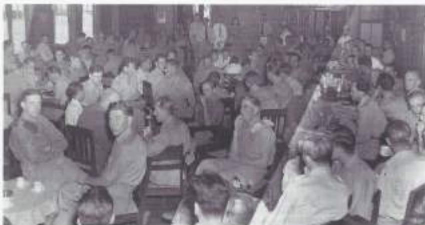
In het Militair Tehuis te Bandoeng.