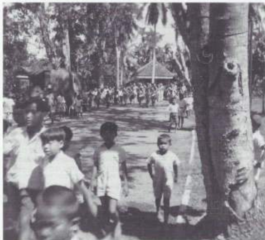
Het Indonesische straatleven

tot wilde stakingen. Het wordt voor de gewone Indonesiër zeer moeilijk. Ook dat werd verwacht maar het probleem wordt er niet minder door. Mijn leven gaat zolang het gaat verder. Om 2 uur thuis, soms wat slapen, anders op de fiets de stad in. In de avonduren studeren, maar ik word vaak gestoord door onverwacht bezoek.