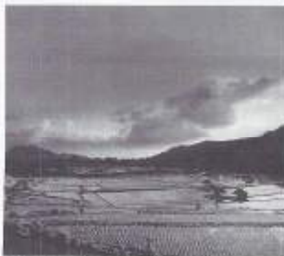
Het Javaanse sawah-landschap

Ik lees het boek van Van Mook en alle sombere gedachten van de laatste jaren worden daarin bevestigd. Bij zijn commentaar op de regeerders uit Den Haag denk ik aan Socrates: domme mensen zijn gevaarlijker dan slechte.