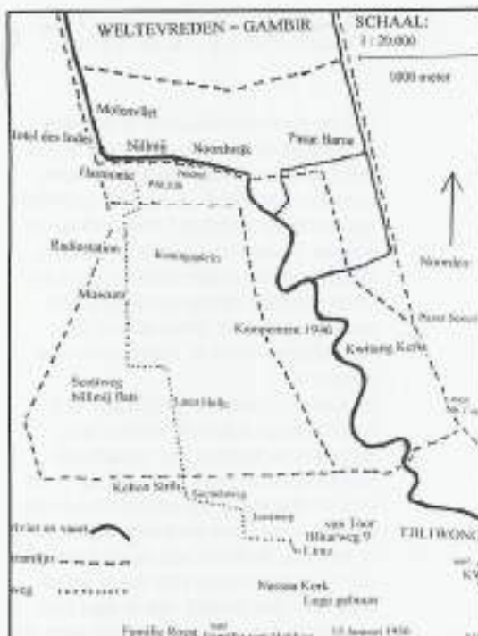
De fietsroute van Menteng naar het centrum

Hierbij een schets van het oude Weltevreden ofwel de Bovenstad van Batavia, dat nu Djakarta heet. Weltevreden werd Gambir. Op de kaart zijn aangegeven de rivier de Tjiluwong, ons bekend van de eerste twee maanden in Batavia doorgebracht. Voorts de vaarten Noordwijk en Molenvliet. De Benedenstad ligt kilometers verder naar het noorden en nog verder ligt Tandjong Priok. Op de kaart zijn de locaties genoemd in de brieven aangegeven. Ook de Sociëteit de Harmonie staat er op. Daar kwam ik eens in de GMC 104 mee in botsing.