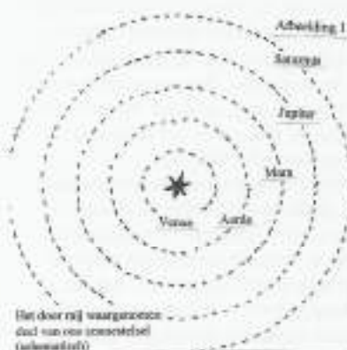
Het door mij waargenomen deel van ons zonstelsel (schetsmatig)

De Maan en Jupiter kwamen dus binnen bereik. Mars schitterde met een rode gloed maar gaf geen details. Venus als avond-morgenster was wel prachtig aan de westelijke hemel, maar het bleef een fel schitterende schijf of schijngestalte. Saturnus lukte aanvankelijk niet, later wel. Dat waren dus de planeten of dwaalsterren (afbeelding 1).