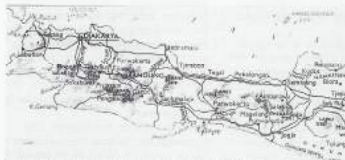
Een kaart van het operatiegebied Midden-Java