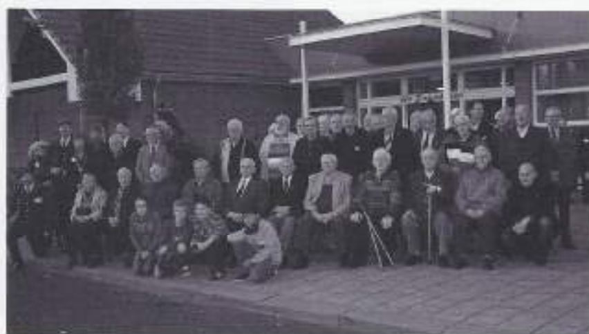
De veteranen uit de gemeente Giessenlanden