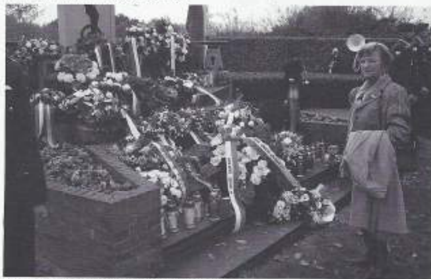
Bloemen als bewijs van dankbaarheid