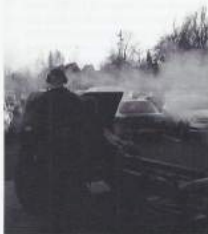
Overdracht met een kanonschot