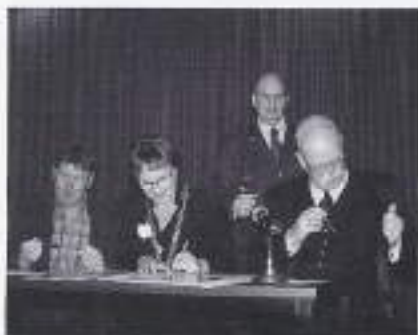
Tekenen van de overdracht onder toezicht van de Korpsadjutant