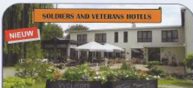
SOLDIERS AND VETERANS HOTELS

Voor gratis folder met actuele informatie over speciale actie weken en veel speciale veteranenreizen Klik op www.BTRreizen.nl of Bel 055 - 5059500