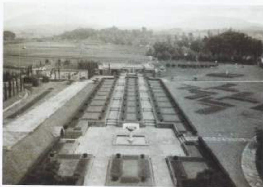
Tropentuin van Villa Isola bij Bandoeng

Bij het schandaal van de sigaretten, het leek wel een mengsel van turf en heil, was er ook nog een tweede gekomen. Het lag in de bedoeling het postverkeer van Indië naar Nederland te beperken door er 30 cent portokosten boven op te zetten, onder het motto "alles voor onze jongens in Indië". Op de postblaadjes kon je maar een beperkt aantal regels schrijven. Maar ook deze gedachtekronkel vanuit Den Haag kon er nog wel bij. Tot overmaat van ramp stond er ook nog heel sarcastisch