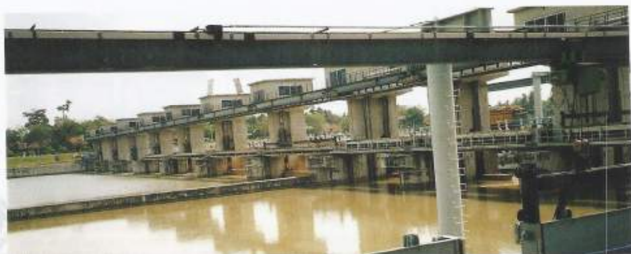
Dam en sluizen in de Air Komerang

met zoon (36) terug naar Zuid-Sumatra in 2002