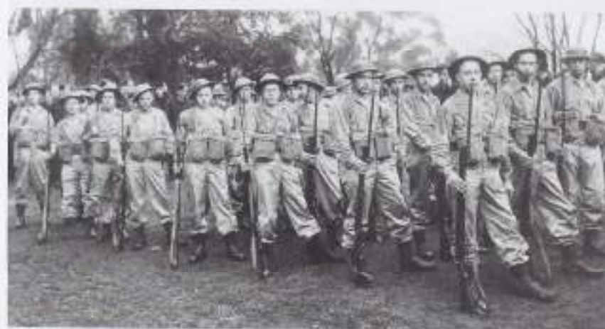
Een peloton van het voortdetachement GBI dat op 24 augustus 1945 deelnam aan de Victory-parade te Melbourne. Vlak voor aankomst brak een enorme regenbui los.

Op 7 oktober 1945 kwam Tandjong Priok in zicht en de volgende dag kon de ontscheping beginnen. De compagnie werd gelogd in een KNIL-kazerne te Batavia en onmiddellijk ingezet tegen de opstandelingen. ■