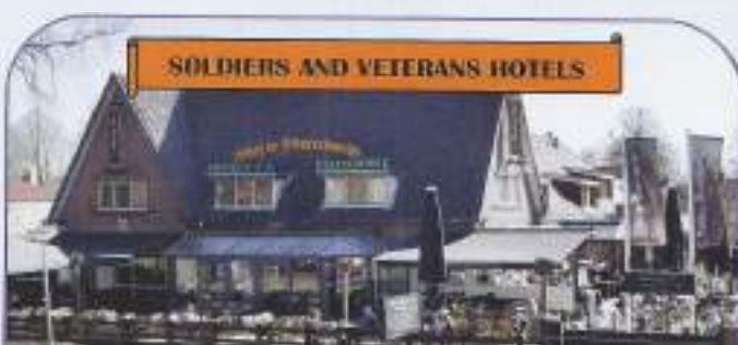
SOLDIERS AND VETERANS HOTELS

5 dagen 'Alles Inclusief' vakantie Zomerseizoen van april t/m okt. 2013 voor € 255,- Veteranen Voordeelprijs € 229,- p.p.