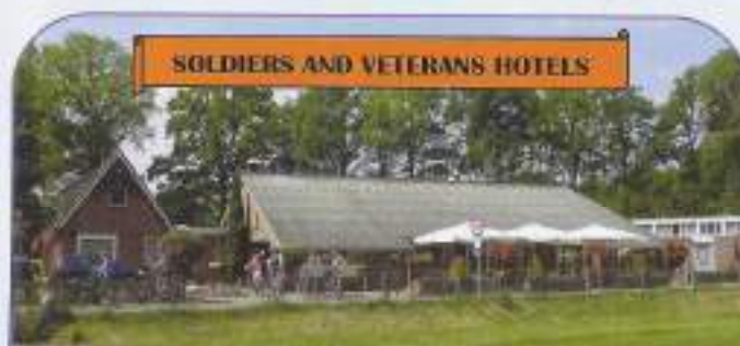
SOLDIERS AND VETERANS HOTELS

5 dagen 'Alles Inclusief' vakantie Zomerseizoen van april t/m okt. 2013 voor € 239,- Veteranen Voordeelprijs € 216,- p.p.