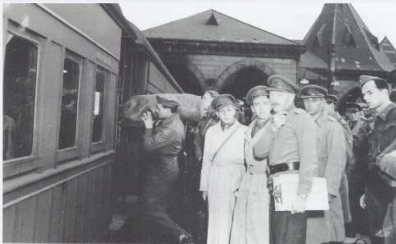
Een officier van het Australische leger (met plankje) begeleidt een groep GBI's die per trein op 24 juli 1945 naar het Darley-camp werd door-geonden.

Gedurende de Tweede Wereldoorlog (1942) rijpte bij de Nederlandse regering in Londen het plan om na de bevrijding van het moederland een Expeditionaire Macht van drie divisies samen te stellen die naast de geallieerden zou deelnemen aan de herovering van Nederlands-Indië. Behalve deze Expeditionaire Macht, die naar Japan zou oprukken, waren er de Gezagsbataljons ter handhaving van orde en rust in het eilandrijk.