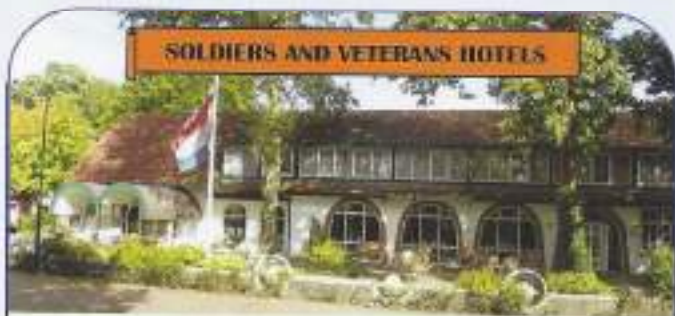
SOLDIERS AND VETERANS HOTELS

5 dagen 'Alles Inclusief' vakantie Zomerseizoen van april t/m okt. 2013 voor € 256,- Veteranen Voordeelprijs € 229,- p.p.