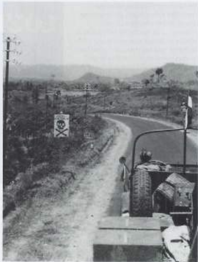
Rit over de Poentjak Pas.

Het klinkt misschien wel hard maar ik zou best om de andere dag in stelling willen komen, iedere dag, dat zou te zwaar worden. Deze dag was ik belast met de vuurleiding en dat is geen gemakkelijke taak. Dat heeft me vele zweetdruppels gekost, maar dat heb ik het liefst. Deze dag hebben we zo'n 200 projec-