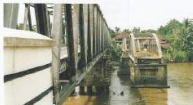
Oude en nieuwe brug te Bantén