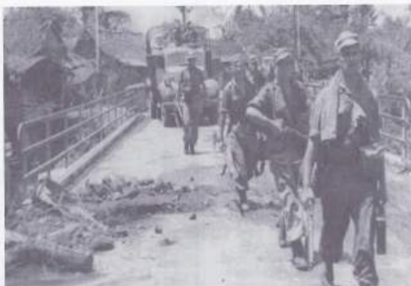
5-6 R.I. patrouilleert in de buitenvijken van Solo