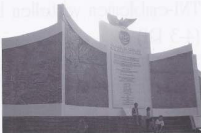
Monument te Lentjang