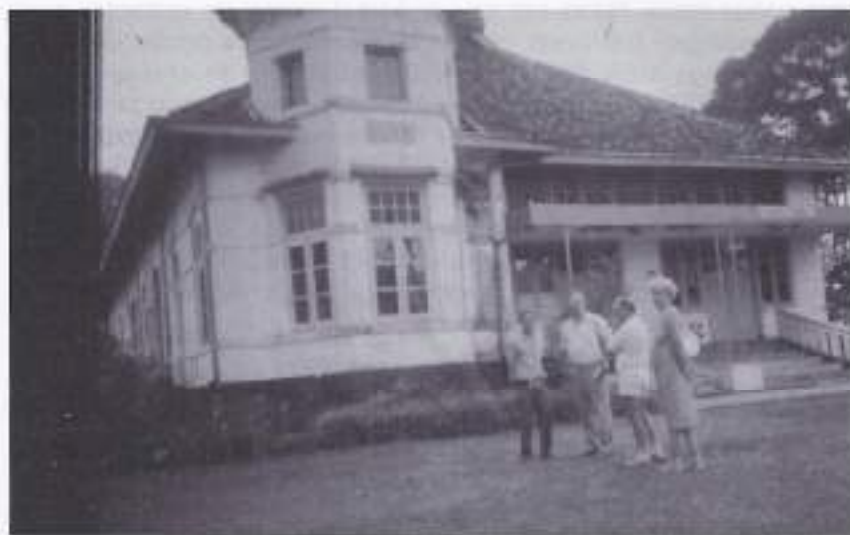
1986, Tjisaroca, villa 'Deetje' met de toenmalige bedrijfsleider waaraan ik de oude foto's liet zien.