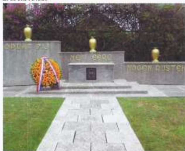
Ereveld Kembang Kuning