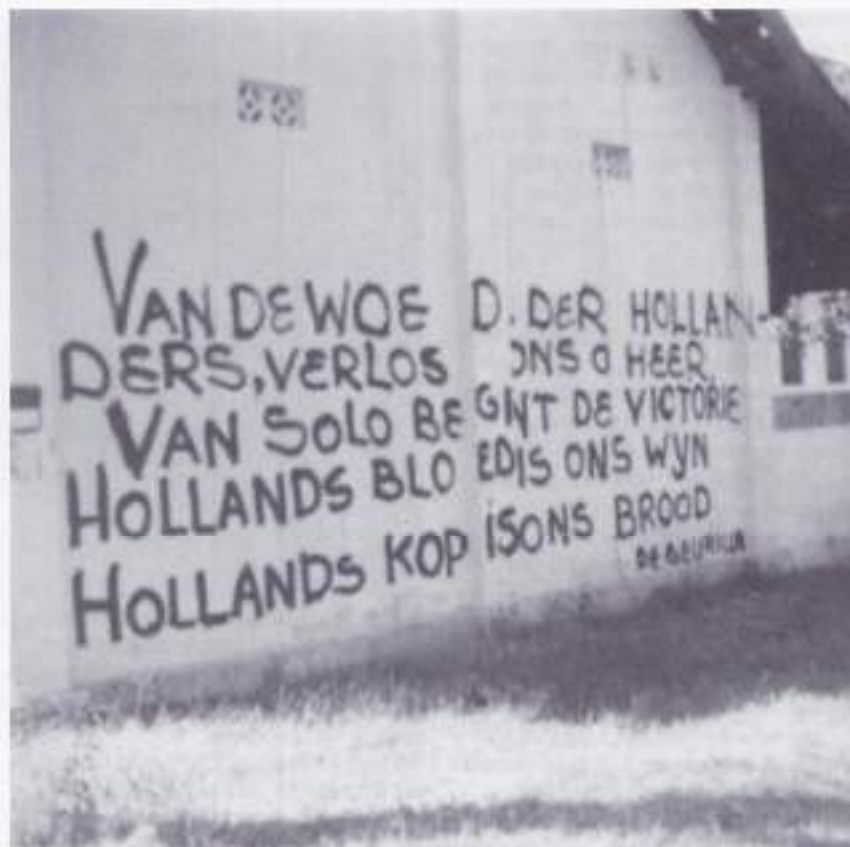
Verzet in Solo: "Hollands bloed is ons wijn. Hollands kop is ons brood."