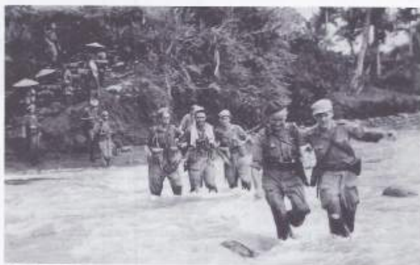
4-5-6 R.I. steekt een rivier over: "Oppassen jongens!"

Begin maart 1948 arriveerden de mannen van 5-6 R.I. op Java. Eerst in Djakarta (Batavia), later in Semarang. Residentie Pekalongan was het eerste bataljonsgebied. De eerste maanden leken mee te vallen. Wel kwam 5-6 R.I. in aanraking met 'peloppers'