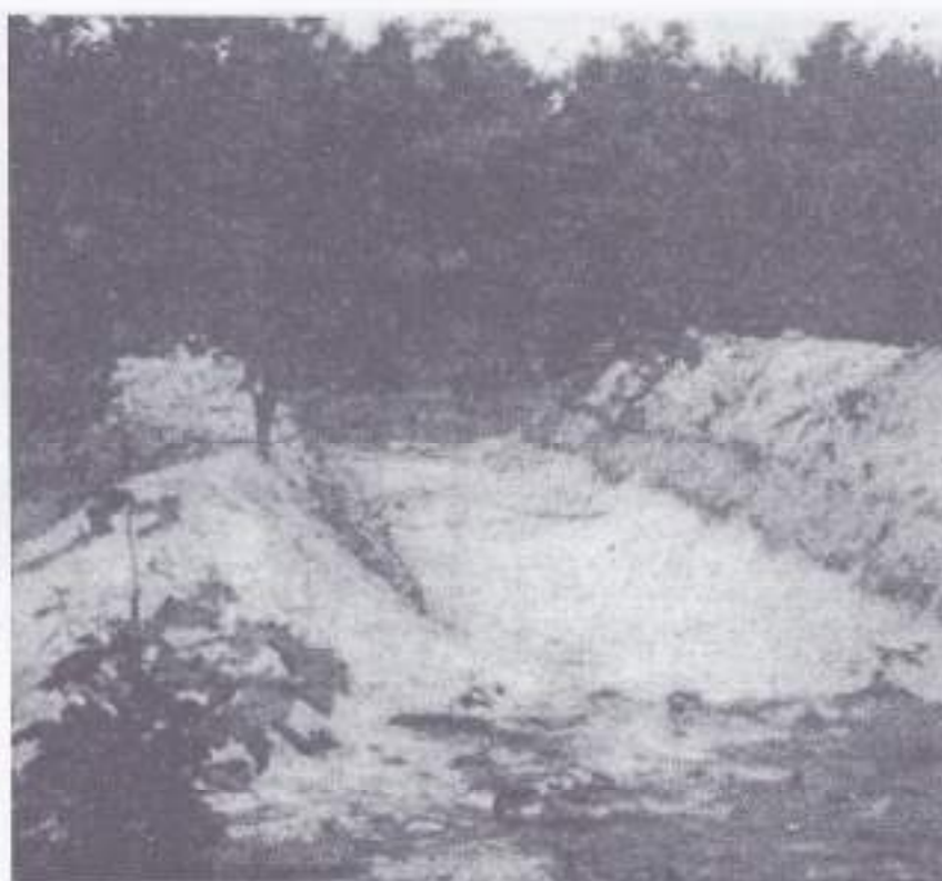
Het geplande massagraf in 1945

Op een gegeven moment werd het geluid van een motor gehoord en werd ook de motor zelf waargenomen. Hierop moeten één of twee para's met Dolf Hoving vanuit het