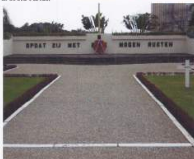
Ereveld Menteng Pulo