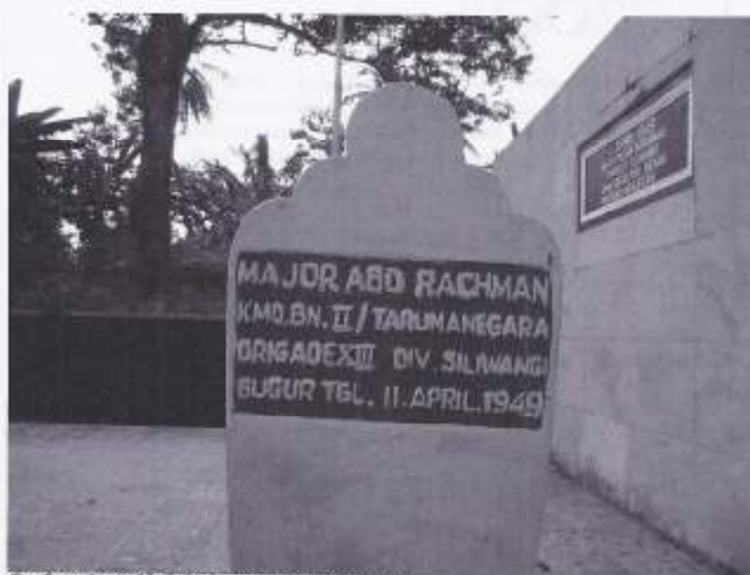
Graf majoor Abdulrahman Natakusumah