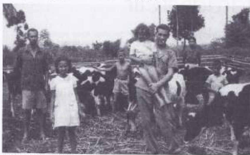
1948. Tjimahi. Bij de kalveren.