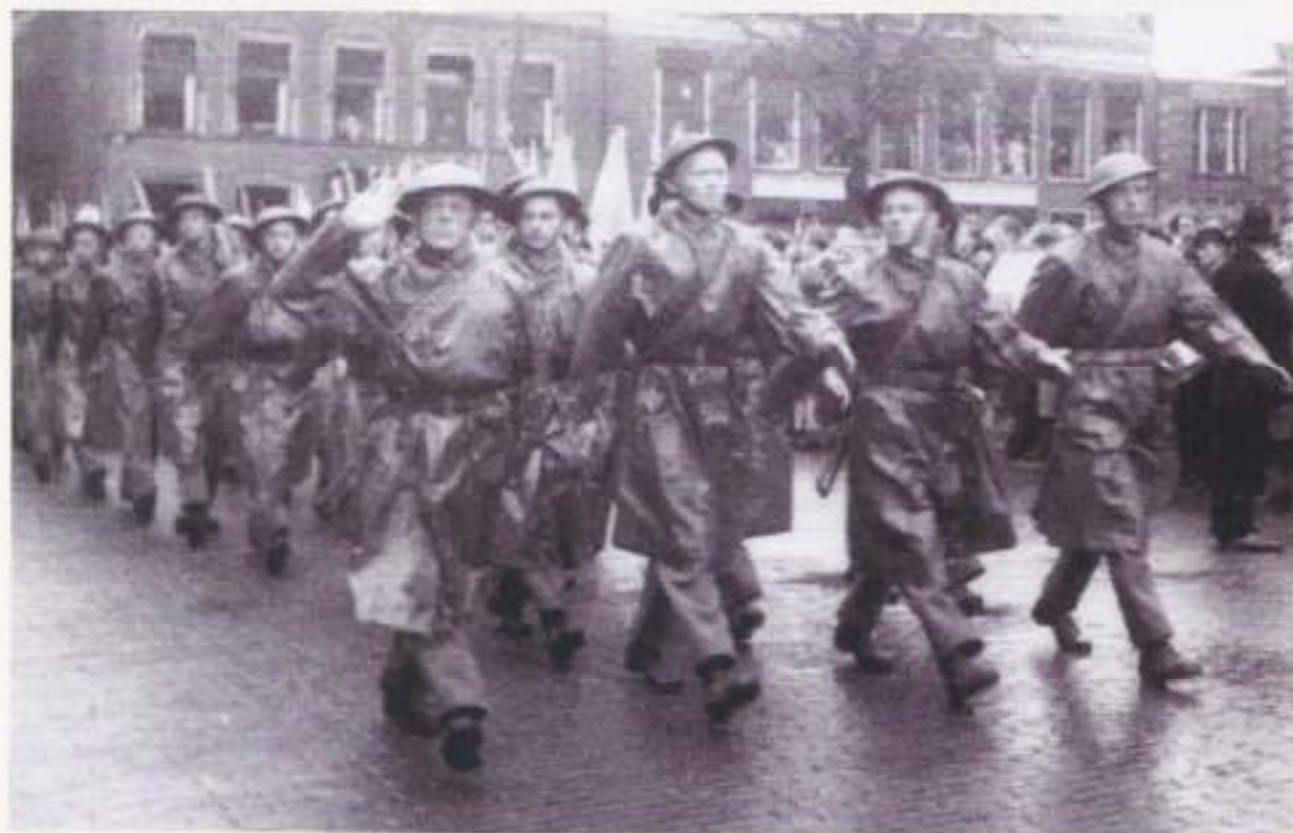
Afscheidsparade en defilé op 26 oktober 1945 te Leeuwarden, vlak voor vertrek naar Engeland.

voor Indië?" Een vraag waarop hij geen antwoord had, maar wat de doorslag heeft gegeven voor het Bataljon "Friesland". Uit heel Friesland kwamen zich verzetsstrijders melden om "ons Indië" te bevrijden van de Jap, zoals dat toen heette. In een paar barakkenkampen in het zuidoosten van Friesland werden ze bij elkaar gebracht. Wie hen daar zag, kon zijn ogen niet geloven dat uit dit "stel ongeregeld" een echt militair onderdeel zou kunnen worden gevormd. De kleding bestond bij een groot aantal uit een overall, het schoeisel bestond uit klompen en/of laarzen. Maar ze waren allen doordrongen van de wil om echt soldaat te worden. Hun opleiding was echt niet kinderachtig te noemen. Tijdens hun BS-periode hadden ze wel geleerd om met wapens om te gaan en tijdens hun verblijf in zuidoost Friesland werd hen de rest bijgebracht. Er was echter nog één probleem nl. de vereiste sterkte voor een