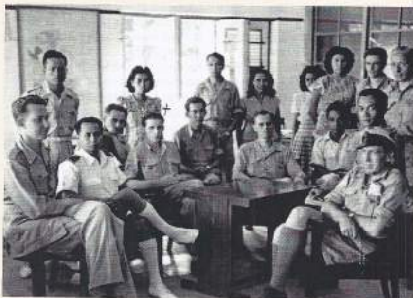
Briefing Marinebasis Pollie