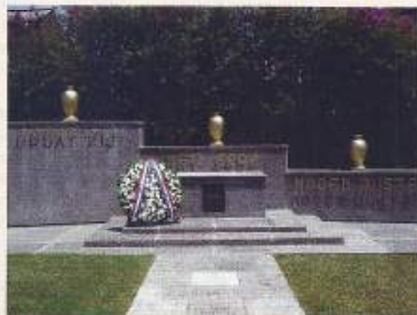
Ereveld Kembang Kuning