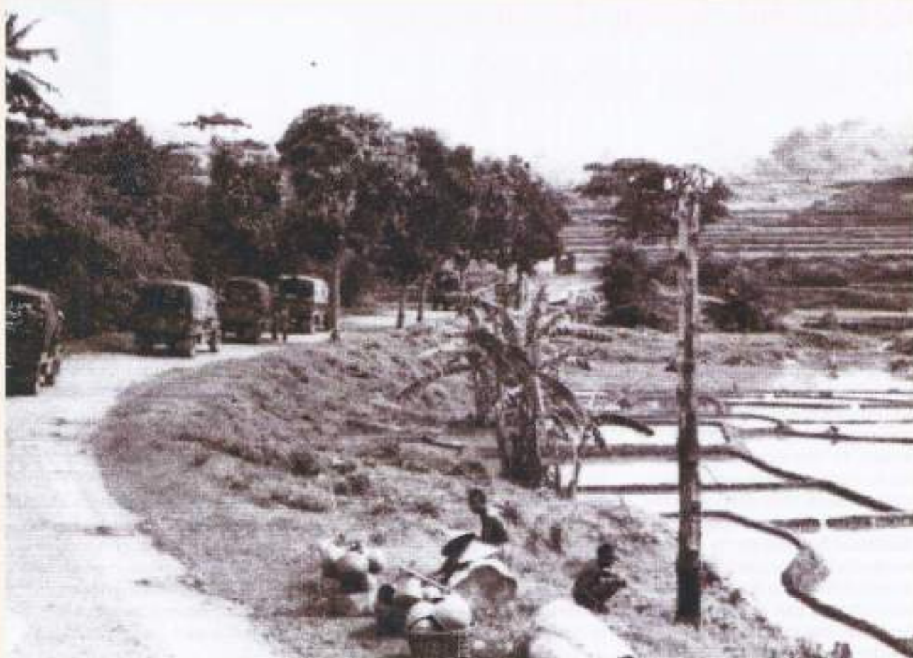
Een colonne onderweg

Wat vroeger allemaal te voet of in de looppas werd gedaan, werd nu gemotoriseerd gedaan. Alles moest snel worden volbracht en waarvoor? De V-Brigade waartoe het Bataljon "Friesland" nu behoorde, was rond juni 1947 volledig getraind. Het materiaal werd steeds meer aangevuld en de mensen vroegen zich af "gaan we nog of gaan we niet?" In de loop van juli 1947 werden de geruchten sterker dat er actie op til was. De republiek werd steeds brutaler, er werd meer gebrandschat en er kwamen weer mijn- en bomaanslagen tot dicht bij de stad Bandoeng. De spanning steeg en met de spanning steeg ook het enthousiasme van voorheen, want wees eerlijk dag in dag uit oefenen etc. en verder niets doen terwijl om je heen weer allerlei getreiter en speldenprikken worden uitgevoerd, dat wil je toch niet. Wij zijn er klaar voor, hoewel men terdege beseftte dat actie ook weer gesneuvelden en gewonden met zich mee zou