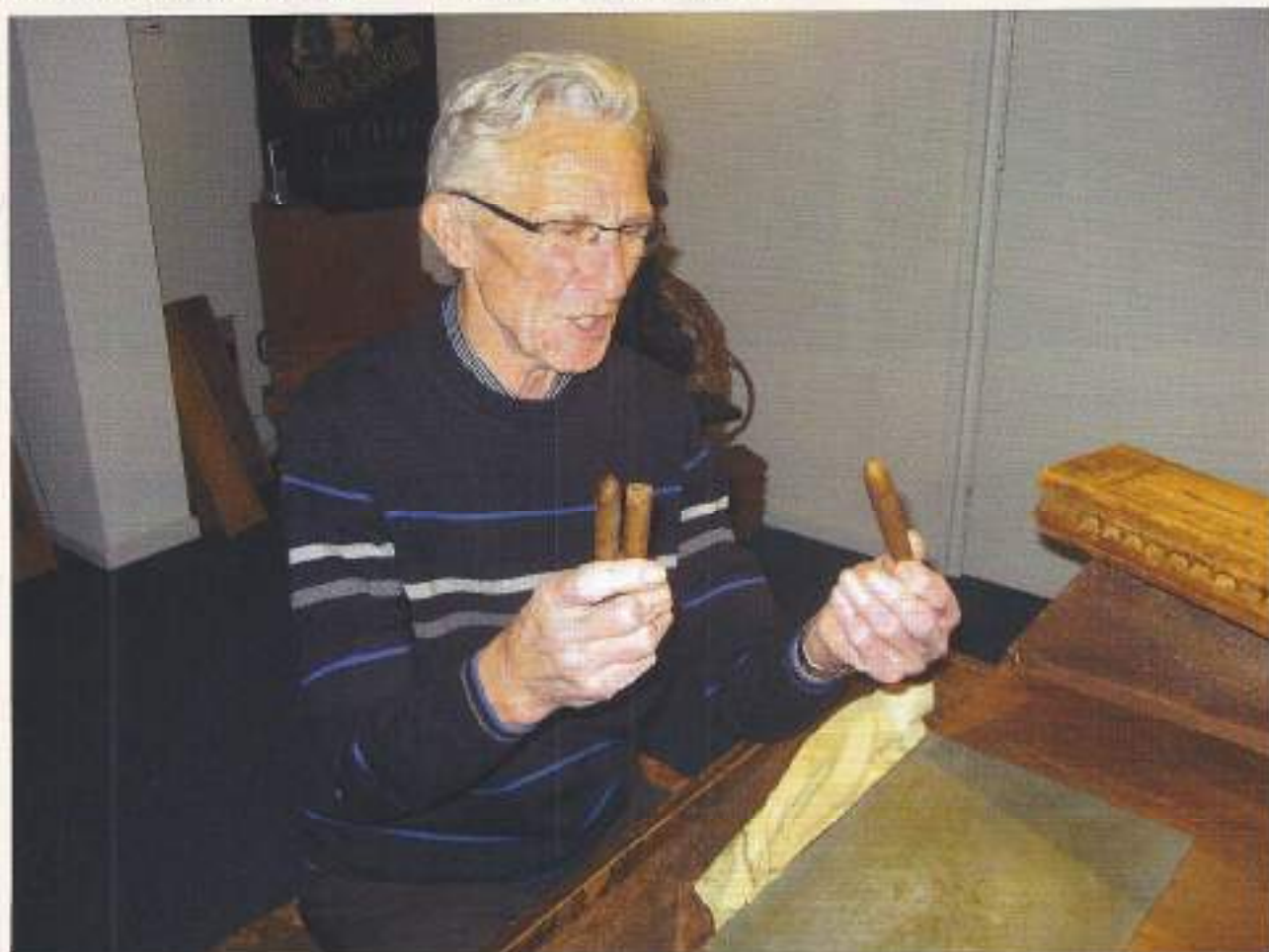
2014, nog altijd sigaren maken