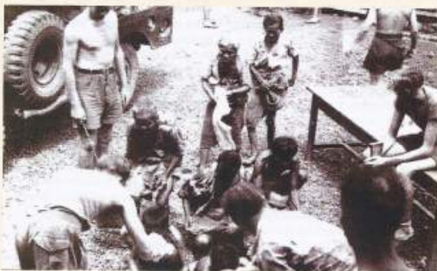
Hulp aan de bevolking. Voeding, medicijnen en kleding

opleiding, dagelijkse appels en exercitie. De spanning viel van de schouders af. Het eeuwige patrouillelopen was voorlopig voorbij. Ze leerden weer gewerschieten op de schietbaan, waarvan de kogelvanger niet de vereiste hoogte had, met het gevolg dat er regelmatig klachten kwamen dat er kogels op onjuiste plaatsen terecht kwamen. Ook andere vaardigheidsproeven moesten worden afgelegd in brigadeverband. Zo kregen enkele honderden mannen van het bataljon een militair vaardigheidsdiploma voor het afleggen van een aantal proeven zoals handgranaatwerpen, hardlopen, zwemmen, prestatiemarsen etc. Men leerde samenwerken met vliegtuigen, met tankeenheden enz., en men hield oefeningen in groot verband en ga zo maar door. Naast de infanterieoefeningen kregen de motorordonnansen het zwaar te verduren met