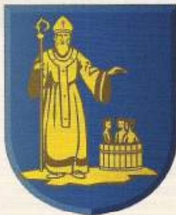
Wapen van Valkenswaard