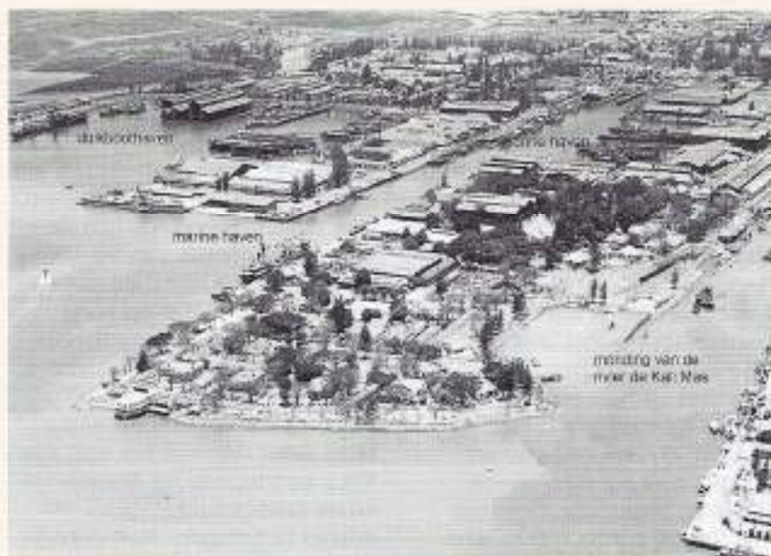
Haven S, Tandjong Perak

mijn hand uit, wat hij heel goed begreep. Hij gaf mij een hand en slikte even iets weg waarop hij zei: "Tja, Rijkie, 't is bijna zover hè", en verder kwam hij niet. Hij was een beetje ontroerd, slikte even en met zijn linkerhand op mijn schouder wenste hij mij een goede vaart en behouden aankomst op Ambon. "Ik hoop dat alles goed verloopt en dat ik later nog iets van je mag vernemen. Hou je haaks jong", zei hij en stak een hand op toen ik wegreed en ik zei tegen hem: "Dag 'Paatje', ik zal u nooit vergeten en bedankt voor alles hè", en hij knikte met zijn vriendelijk gezicht. Het was goed dat ik wegreed, want ik kreeg het ook even te kwaad.