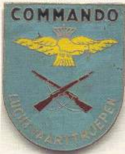
Logo Commando Luchtvaarttroepen