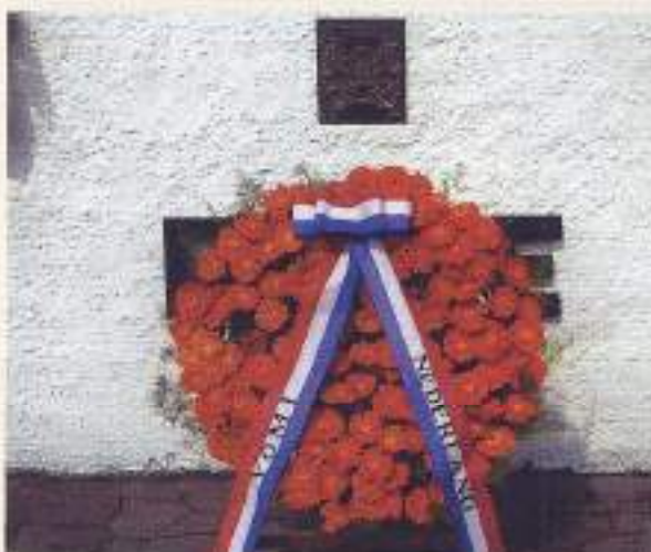
Ereveld Menteng Pulo