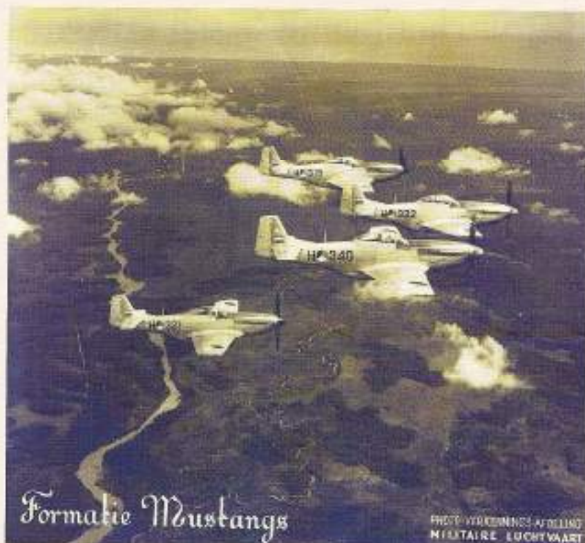
PVA Militaire Luchtvaart

hele compagnie is ingezet. Af en toe is er een korte rust- en/of verlofperiode. Er wordt dan gevoetbald in het plaatselijke stadion of een uitstapje naar Solo gemaakt.