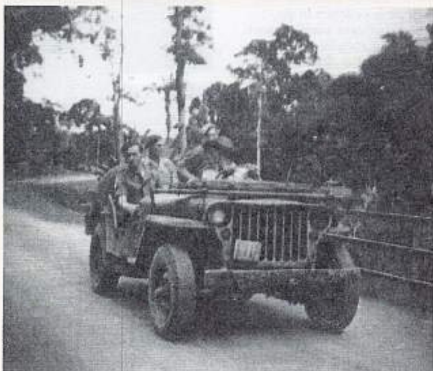
Op weg tussen Batoeradja en Loeboek Batang

uit Rotterdam zat achter de chauffeur en was ook gewond geraakt, maar hij is er wonder goed van af gekomen. Het puntje van zijn neus hing er nog met een velletje aan. Een ander die zijn hoofd boven het voertuig uitstak kreeg een scherp tegen zijn hals. Enkele anderen hadden ook kleine scherfjes in hun armen. God heeft mij weer gespaard.