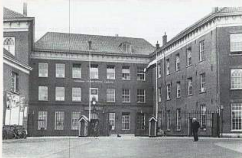
Voormalige Van Heutszkazerne te Kampen