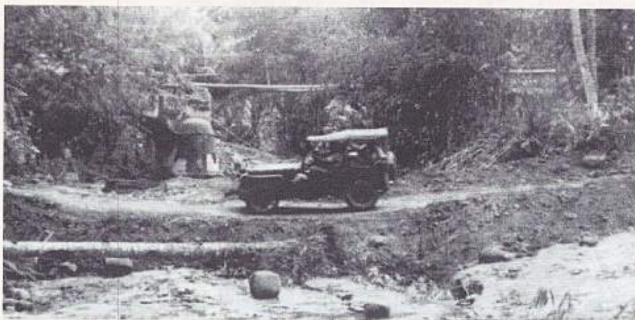
Slechte wegen op Java tijdens de actie

vrijwel geheel onbeschadigd in Nederlandse handen. Direct werd ook de nabije omgeving van de stad gezuiverd en bezet. Op 26 juli werd de stad overgedragen aan de W-Brigade die voor beveiliging en zuivering van het gebied rond Cheribon moest zorgen. De V-Brigade, met 1-9 RI in de gelederen, vertrok op 26 juli richting het oosten. Het Bataljon 'Friesland' ging naar Slawi ten zuiden van Tegal. Dit gebied was reeds door een voorhoede van 1-9 RI bezet en gezuiverd. Op 29 juli kwam er een nieuw marsbevel om op te rukken naar het zuiden. De tocht die 's