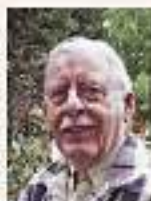
R.J. de Rijk

*Op de marinebasis worden op dit moment vele LST-landingschepen en oorlogsschepen volgeladen met oorlogsmateriaal. De landingsvaartuigen L.9607, L.9608 en L.9609, alsmede de reeds overgedragen Hr. Ms. Woendi, Hr. Ms. Wambrau en Hr. Ms. Sorido zijn bijna afgeladen. Strijdkrachten van de TNI worden in kazernes in gereedheid gebracht om op korte termijn aan boord van die schepen te gaan om de aanval op Ambon en de Zuid-Molukken kracht bij te zetten. Kortom, u weet zelf wel in welke stroomversnelling de Nederlands-militaire liquidatiepolitiek terecht is gekomen en dat vele Nederlandse en Ambonese vlagofficieren schaamteloos de helpende hand toesteken aan de Japanse collaborateur Soekarno en zijn TNI-soldaten. Welnu, ik stel u thans het volgende voor en beschouw dat dan als een oprecht advies. Indien u werkelijk van plan bent op de 25-ste juli 1950 te 00.00 uur middels een revolte in opstand te komen, wat ik overigens zou toejuichen en wat ik een zéér goed plan vind, moet u op dat moment met uw 500 man KNIL-militairen de gehele marinebasis bezetten, alle strategische punten innemen, zoals b.v. de Turbocentrale, de wapenkamer van de Kraton, politieposten kazerne Kruiserkade, politieposten aan de Ferwerdabrug en de Admiraal Helfrichboulevard, personeelskazernes van o.a. marinepersoneel terstond consigneren etc. Daar heeft u ca. 100 man KNIL-troepen voor nodig. Vergeet niet de radio- en radarpost boven in het flatgebouw van de marinekazerne Kruiserkade. Met