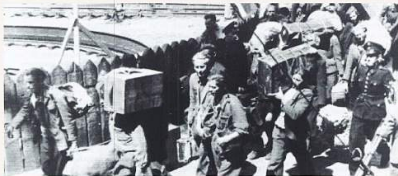
Razzia in Den Haag, november 1944

Dinsdag 22 november vertrokken we met onbekende bestemming naar....? Het