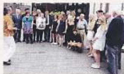
Na afloop een groepsfoto: veteranen en studenten in saamhorigheid bij elkaar

Voor de reünie op zondag 20 september 2015, zie het artikel hieronder.