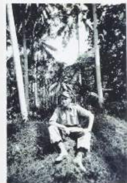
Onder de palmbomen