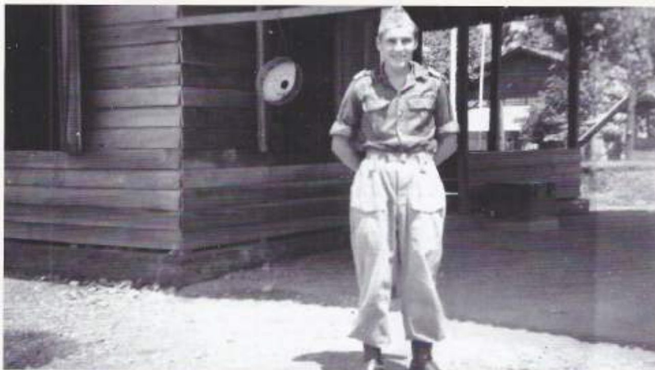
Achter mij het wachtlokaal