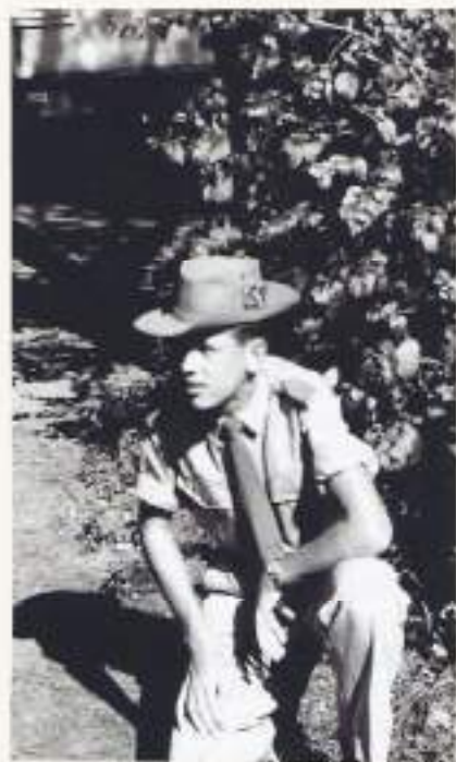
Cees in tropentenuis

Vroeg in de morgen wordt vertrokken naar Hoek van Holland, waar tss Groote Beer gereed voor afvaart ligt. Enkele toespraken, een korte plechtigheid en daar gaat ie dan, een vaart die 45 lange dagen zou duren. Via de Atlantische Oceaan naar Curaçao, door het Panamakanaal, langs Mexico, via de Stille Oceaan naar Hawaï en dan naar Nieuw-Guinea. Op Hawaï mag even worden gepassagierd, een enkeling probeert 'zijn snor' te drukken. Bijna altijd tevergeefs, met een fikse straf aan de broek wordt 'de spijbelaar' door de Amerikaanse marine weer keurig aan boord afgeleverd en meteen in het vooronder gesmeten. Tijdens de reis slaat de verveling toe, er is een brand- of alarmoefening, lessen hygiëne of medisch advies over tropenziektes door de scheepsarts e.d. maar er wordt vooral veel gesport. Improvisatie