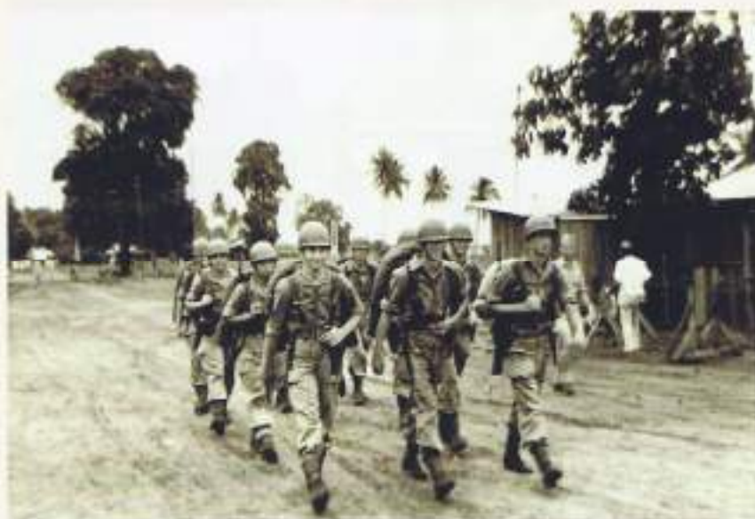
Terug van patrouille