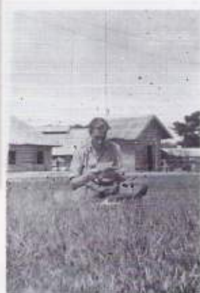
Diep verzonken in de eerste brieven van thuis

Gisteren moest alle bagage weer worden ingepakt voor het vertrek naar Palopo. Omdat Palopo een echte buitenpost is, krijgen we eigen sportartikelen mee. Een goede zaak, ontspanning is immers beslist noodzakelijk.