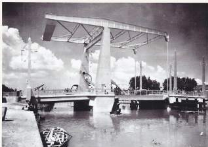
Admiraal Ferwerda-brug over de Kali Mas te Soerabaja. De grootste beweegbare brug in Nederlands-Indië met elektrische bediening.

bene in samenwerking met het Koninkrijk der Nederlanden onder supervisie van de omstreden Hirschfeld, de jonge R.M.S. willen aandoen. Voor ons verzet bestaan geen blauwdrukken, want er bestaat geen surrogaat voor het erkende zelfbeschikkingsrecht.